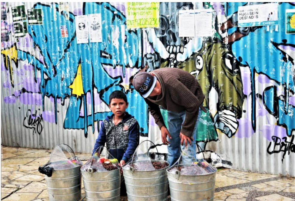
México son sus niños trabajadores.