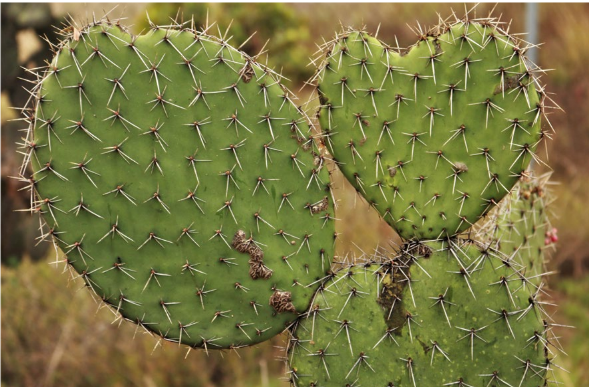
México es su naturaleza.