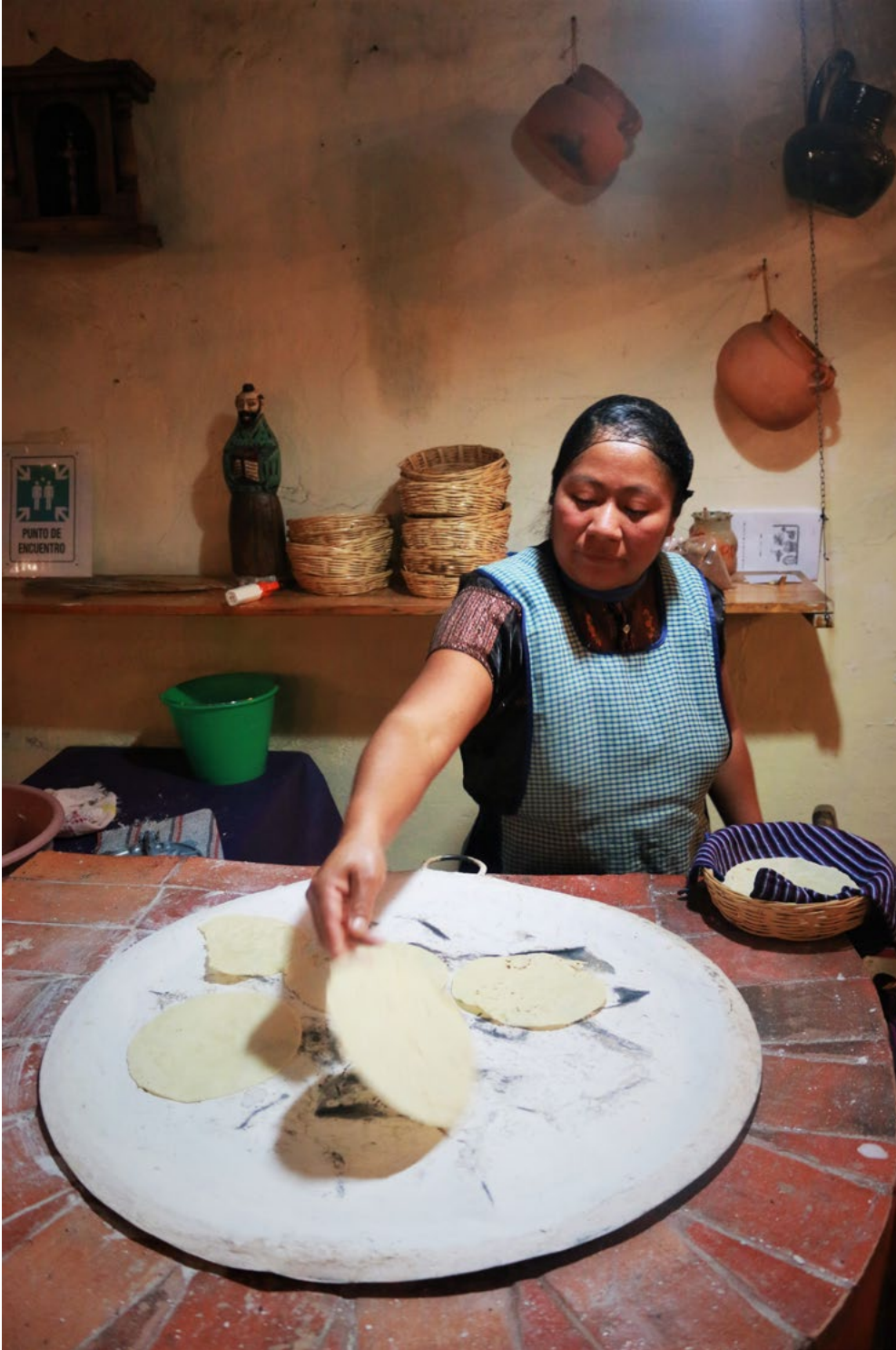
México es su comida.