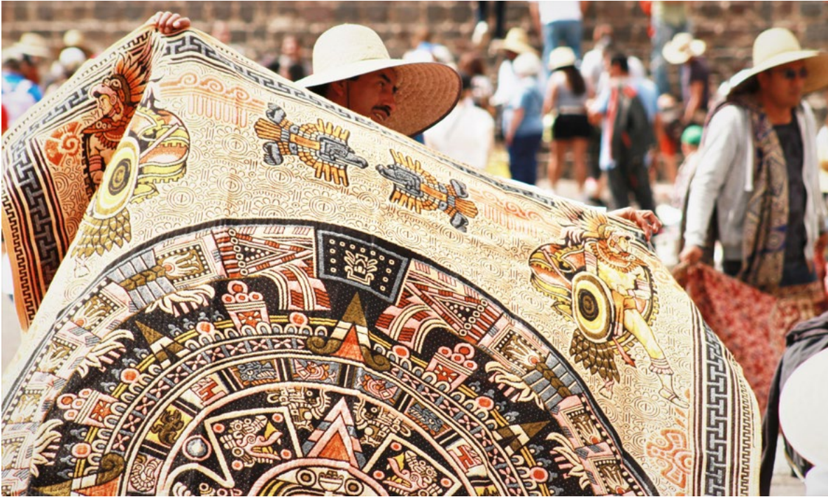
México es su artesanía.