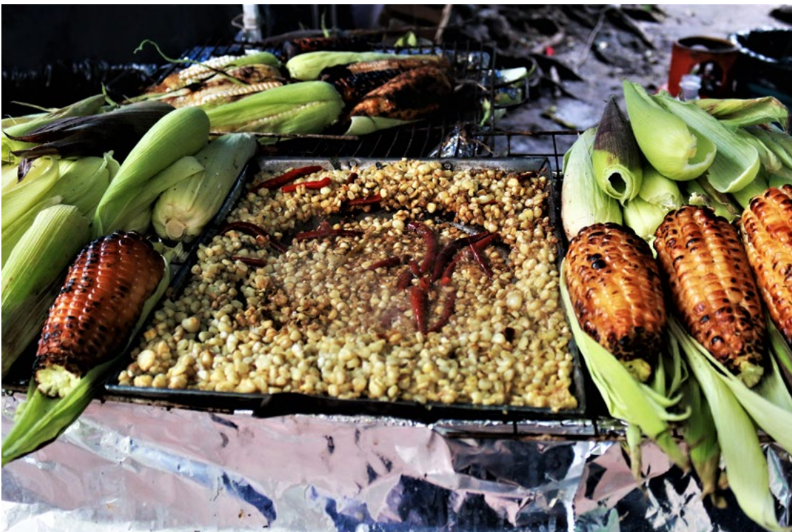
México es un elote.