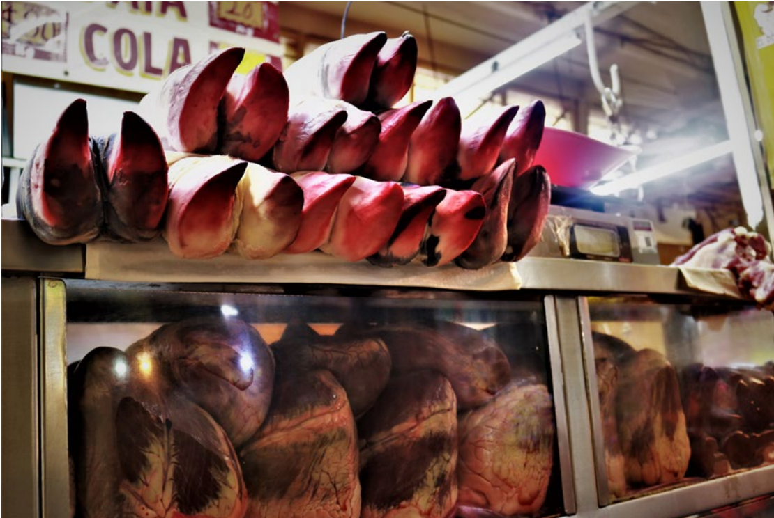
México es una carnicería.