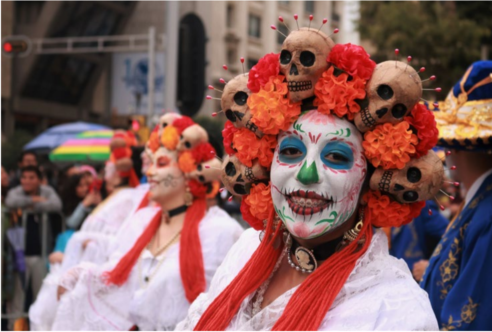
México es un carnaval.