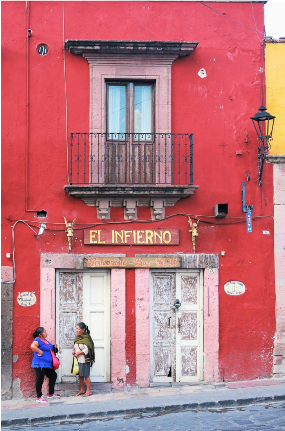
México es un enigma y patrimonio de la humanidad.