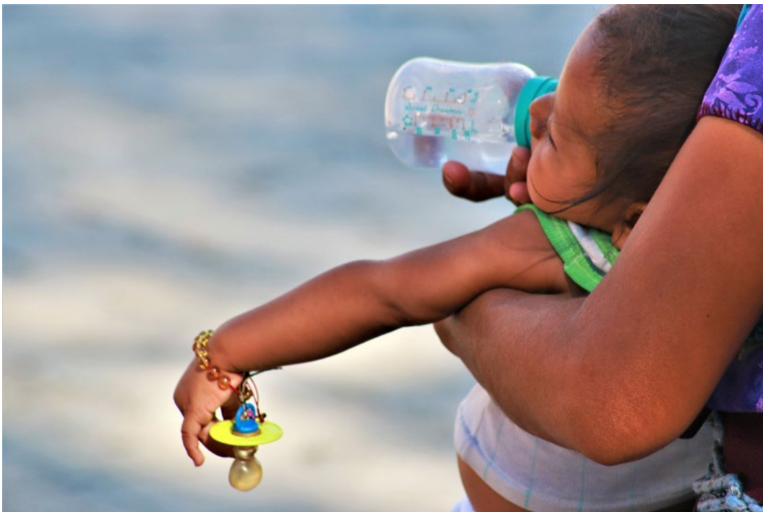
México son las madres.