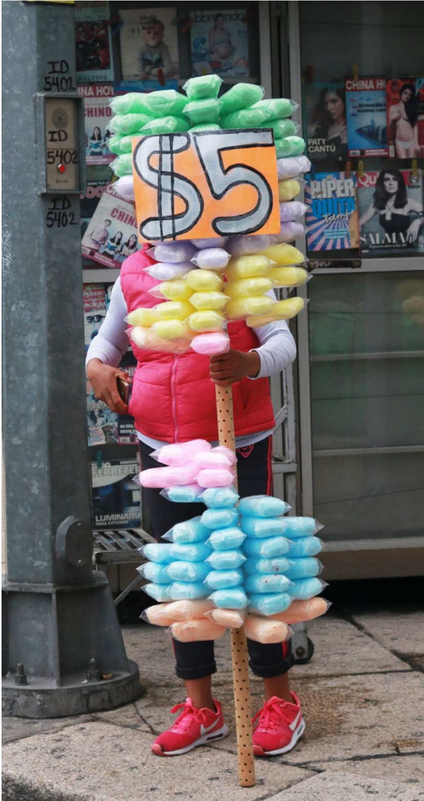
México es su gente.