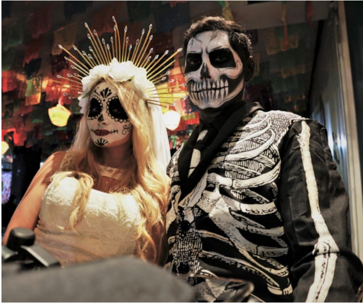
México es la celebración del Día de los Muertos.