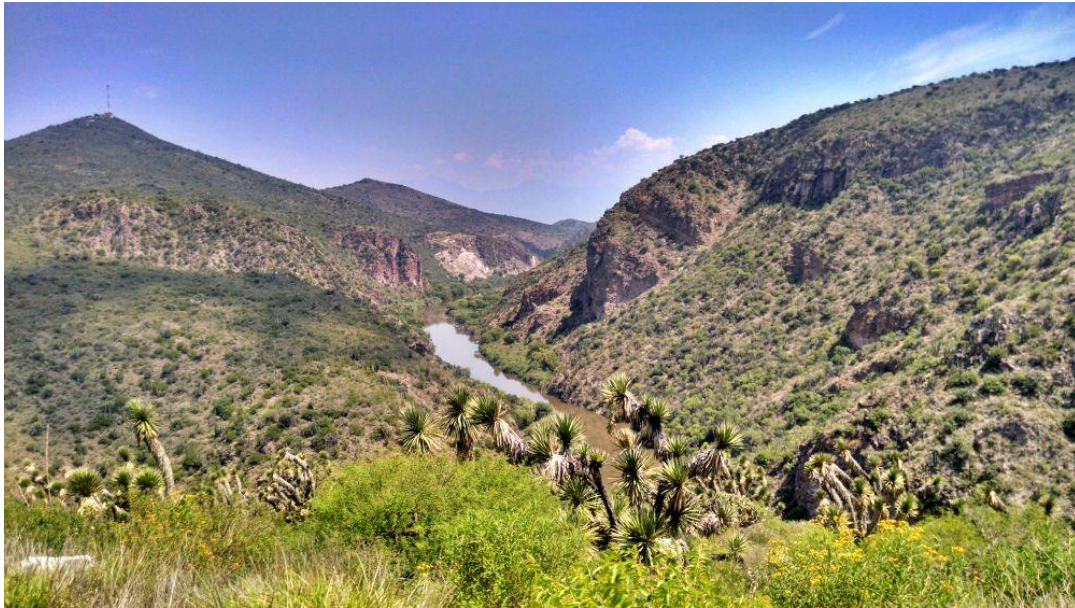
Reserva Ecológica Privada el Gran Cañón