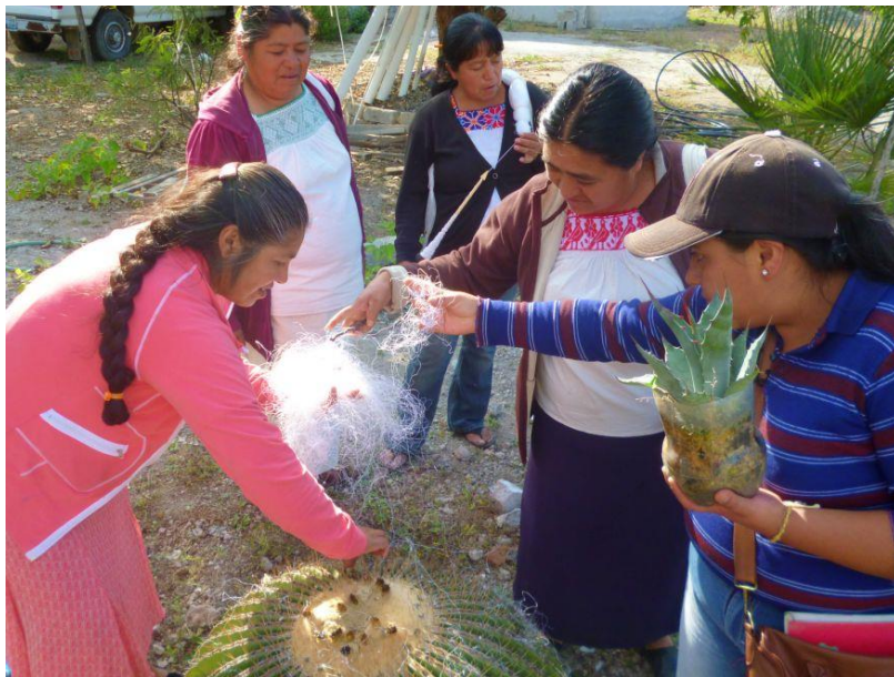
Reserva Ecológica Privada el Gran Cañón