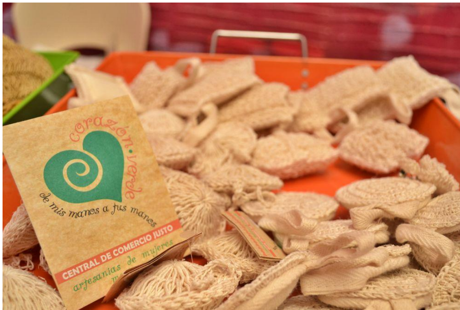
Cooperativa Yamunts'í B'éhna (mujeres reunidas)