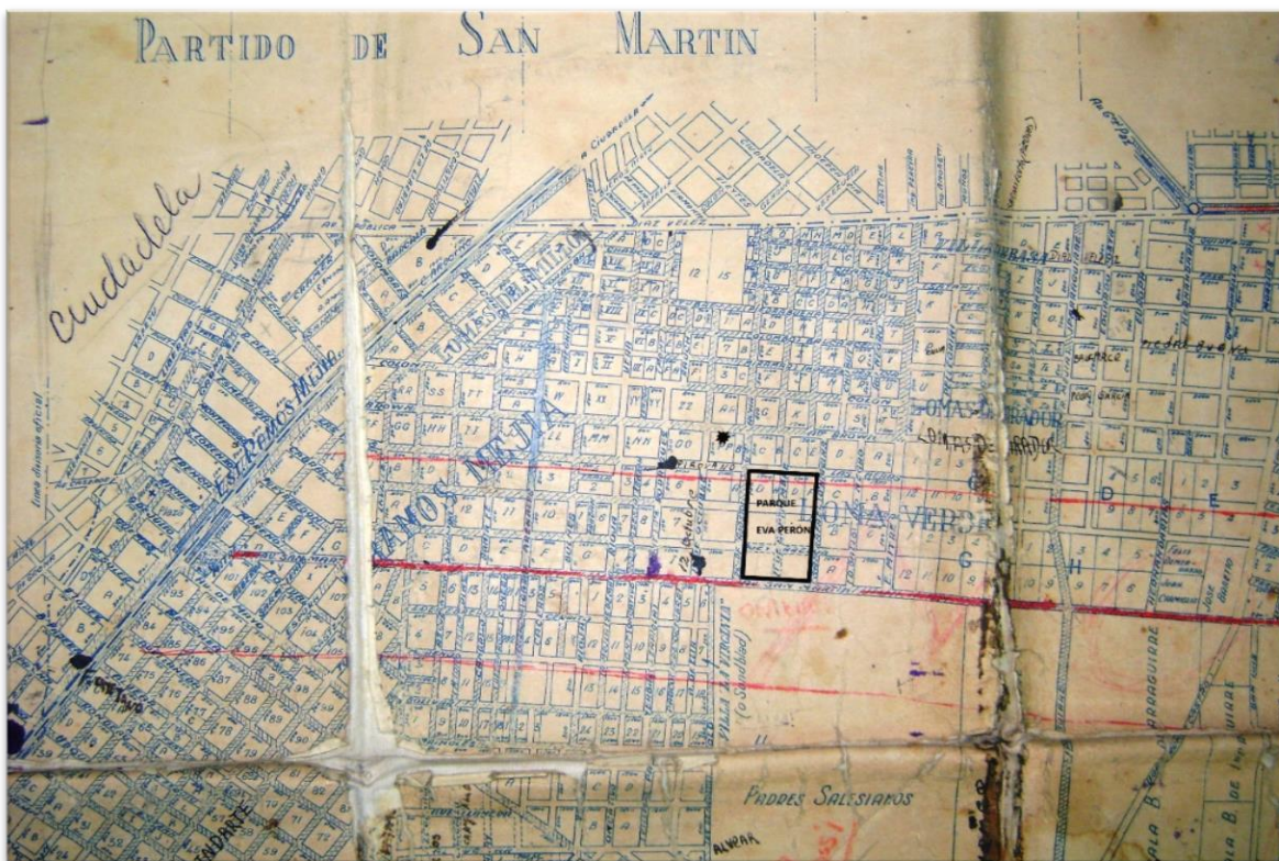
Figura 5. Plano con la ubicación del proyectado parque Eva Perón. El recuadro negro marca los límites del parque Eva Perón. Arriba a la izquierda de este, el punto negro indica la ubicación de los talleres gráficos de Nueva Idea .

En la figura 5 se puede observar la ubicación del proyectado parque Eva Perón.