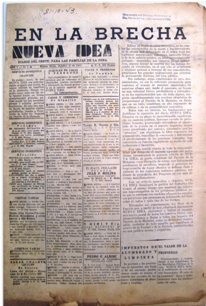
Figura 1. Portada del número inaugural del periódico Nueva Idea , 1 de octubre de 1943.

los gobiernos municipales. Aquí se revela el periódico como actor político con la misión de influir en la toma de decisiones políticas de las autoridades comunales (véase figura 1).