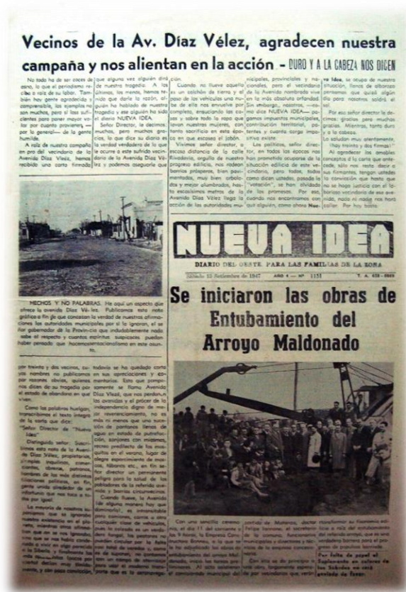
Figura 3. Se observan en esta portada las referencias a las obras mencionadas de pavimentación de la Av. Díaz Vélez y entubamiento del arroyo Maldonado. Portada de Nueva Idea , 13 de septiembre de 1947.

Durante esta época, Nueva Idea continuó bregando por la realización de obras de mejora urbanística y de salubridad, haciendo suyos los reclamos del vecindario, entre las que se destacaron la pavimentación de la Av. Díaz Vélez y el entubamiento de la sección matancera del arroyo Maldonado (figura 3).