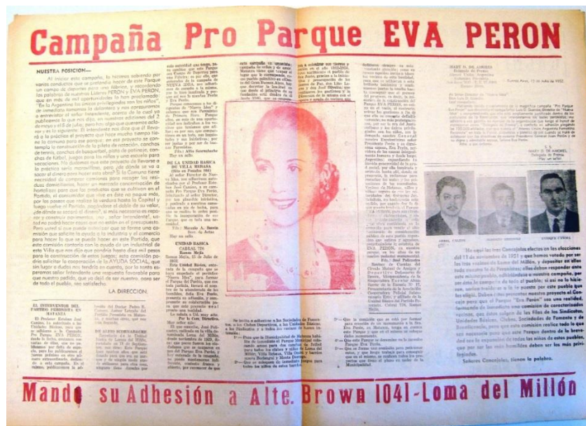
Figura 4. Página central promocionando la creación del parque Eva Perón. Nueva Idea , 17 de julio de 1952.