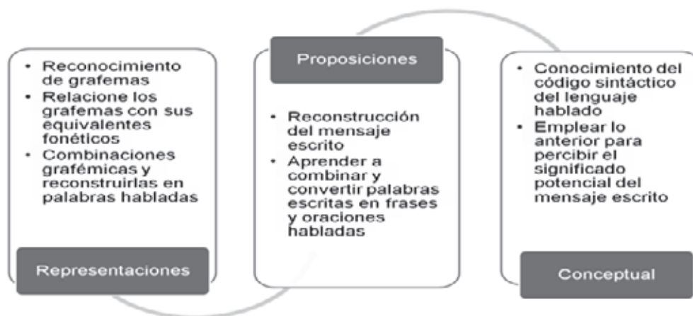
Figura 1. Proceso de aprendizaje de la lectura

Para algunos lectores es suficiente esta respuesta, pero a otros inmediatamente les surge otra pregunta: ¿cómo se haría para que el estudiante en los primeros grados aprendan a trasladar mensajes del lenguaje escrito a lenguaje oral? Para contestar ello, cabe anotar los diferentes tipos de aprendizaje que propone Ausubel (1980, p. 55-63) aprendizaje de representaciones, de proposiciones y de conceptos. Con base en lo anterior, se afirma que en los primeros grados escolares se inicia por la alfabetización, que es convertir palabras escritas en palabras habladas. En estos grados se trabaja en la identificación de los grafemas; seguidamente se enseña la relación del grafema con su equivalente de fonema, prosigue con las diversas combinaciones del grafema (palabras) y finalmente desarrollar la competencia de reconstruir el mensaje escrito en forma de palabra hablada. Esto requiere que el individuo aprenda a combinar y convertir grupos de palabras escritas en frases y oraciones habladas, para lograr esto se deben aprender las funciones sintácticas de las palabras del mensaje escrito a fin de percibir su significado proposicional que lo traduce a un mensaje hablado, confiando también en su conocimiento intuitivo de la sintaxis del lenguaje hablado.