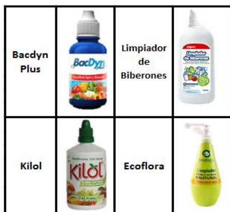
Figura 1. Productos para desinfección:

Sin embargo a comparación de la oferta de productos en dicho mercado, se ha manifestado que las amas de casa no tienen conocimiento de estos ya que los productos y métodos utilizados por dicho público objetivo con el fin de limpiar y desinfectar los alimentos son más cotidianos, los cuales hacen referencia al jabón de cocina, el vinagre, límpido, cloro y en algunos casos se mezclan estos productos para la desinfección como el jabón y el vinagre o jabón y límpido entre otros.