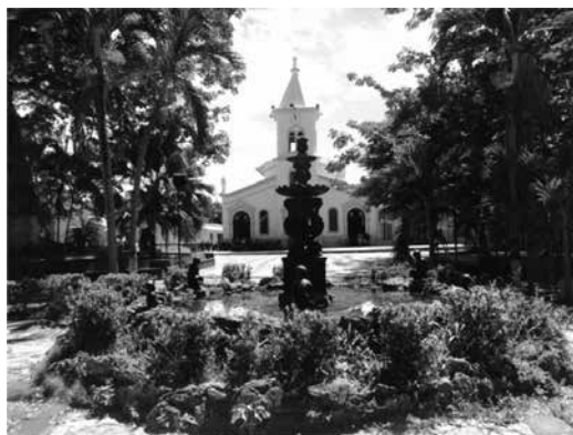
Foto 2. Plaza principal del municipio de Purificación. Al fondo la Iglesia de Nuestra Señora de la Candelaria.

La Plaza Mayor, conocida hoy como el parque de la Candelaria en honor a la Parroquia que data de los años de la fundación del municipio de Purificación, ha sido escenario de memorables acontecimientos. En el centro de la plaza se plantó el árbol de la justicia. Allí mismo sucede la toma por parte de Diego de Ospina Maldonado y por tanto, la ceremonia de fundación de la Villa; eventos como los juramentos de los monarcas españoles, la proclamación del acta de independencia del municipio, pero también el sacrificio de nuestros mártires. En esta amplia plaza pernoctaron los ejércitos patriotas de Antonio Nariño y del Libertador Simón Bolívar.