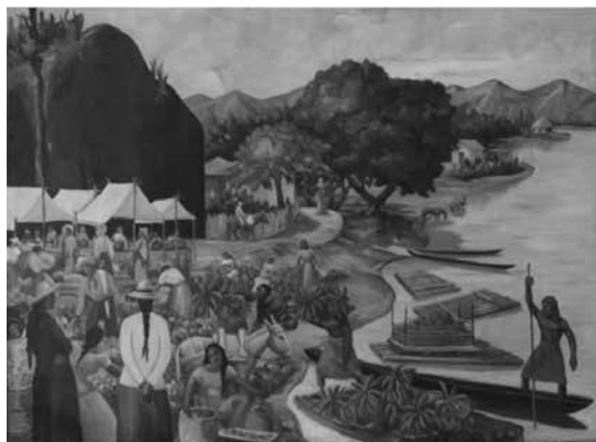
Pintura que representa la Villa de las Palmas de los ancestros. (Autor desconocido.)

Las hogueras de ají, borrachero y de otras plantas irritantes y venenosas se cuentan entre las armas de guerra infalibles de los Poincos. No usaban flechas, como otras tribus indígenas, si no que se defendían con picas o lanzas fabricadas de maquenque o chontaduro, cerbatanas y dardos arrojados, macanas de palma, ondas y piedras cortantes.