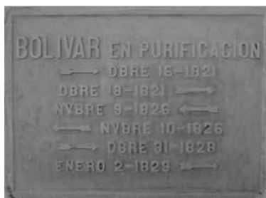
Foto 1. Placa conmemorativa en la casa colonial en la plaza del municipio de Purificación.

El 27 de septiembre de 1813 llega Antonio Nariño con su ejército libertador a la Plaza Mayor de la Villa de Purificación. El 16 de diciembre de 1821, llega por primera vez el Libertador Simón Bolívar, como lo atestigua una placa en memoria de este suceso.