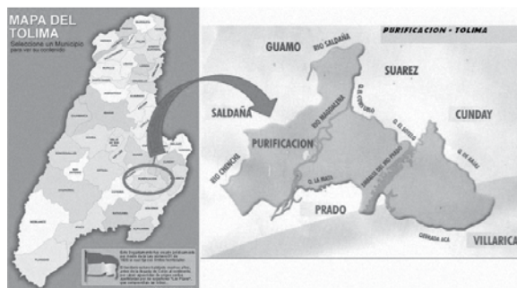
Mapa 2. Ubicación del municipio de Purificación en el departamento del Tolima

El municipio de Purificación limita al norte con los municipios de Guamo, Suárez y Cunday; al sur con los municipios de Coyaima y Prado, al oriente con el municipio de Villarrica y por el occidente con el municipio de Saldaña. (Mapa 2)