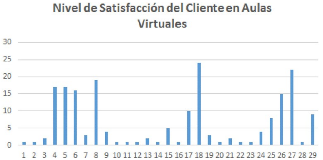
Figura 2. Nivel de satisfacción del cliente de aulas virtuales.

Teniendo en cuenta que la serie de datos no muestran una distribución normal se utilizó el programa Minitab para normalizar los datos y encontrar el nivel de tolerancia adecuado, ir evaluando las fallas, determinar sus causas y mejorar el proceso. A continuación se muestra la tabla de datos original y los datos normalizados.