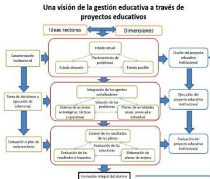
Figura 2: Proceso de diseño, ejecución y evaluación de proyectos educativos

En la figura 2 se revela cómo se articulan las ideas rectoras que guían y fundamentan el diseño del proyecto educativo y las dimensiones que pautan su desarrollo y cómo tributan a la formación integral del alumno.