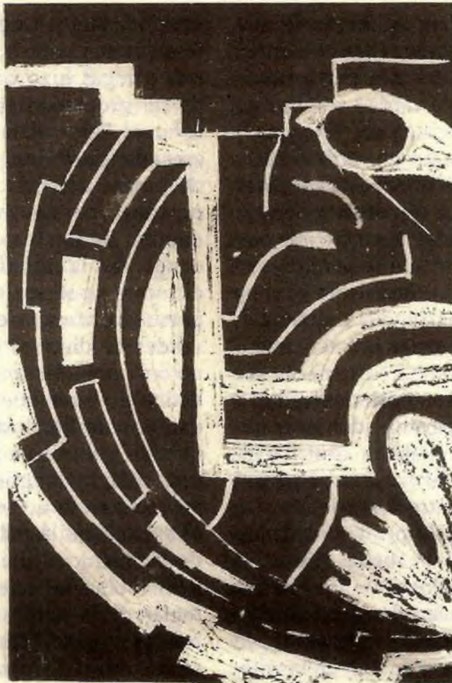
Ilustración: Diana Yamile Olarte

jetivadas por los filósofos milesios mediante el empleo novedoso del artículo determinado griego τό 3 : lo terroso, lo húmedo, lo caliente y lo seco; cada elemento produce un efecto físico preciso que se puede expresar con los términos neutros del lenguaje griego. Los filósofos de Mileto se atreven así a pensar y vivir en el interior de un mundo que se explica por su coherencia causal interna, por las relaciones que tienen las cosas entre sí, y no por la intervención de los dioses. Los pensadores