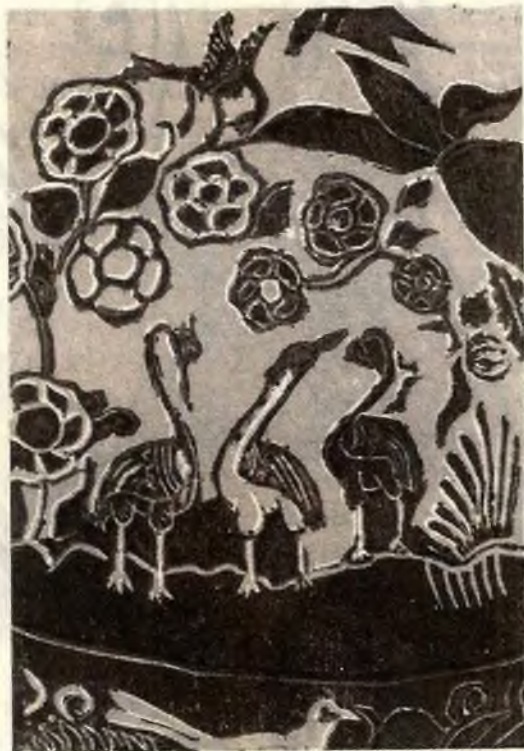
Ilustración: Marco Aurelio Mendez S.