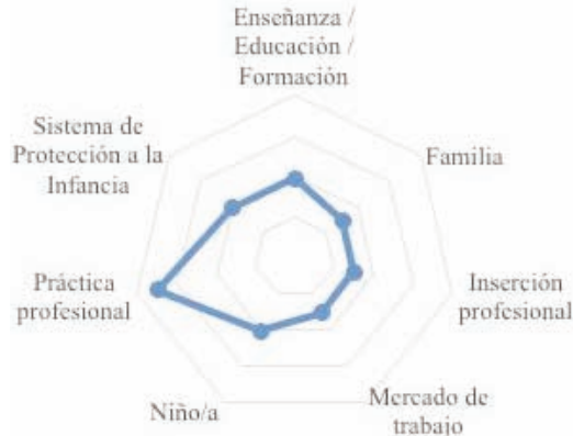
GRÁFICO 8: Joven social. Cruzamiento con las principales palabras clave. Valores sobre total