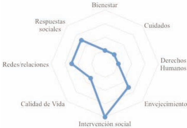
GRÁFICO 5: Personas mayores. Cruzamiento con las principales palabras clave. Valores sobre total