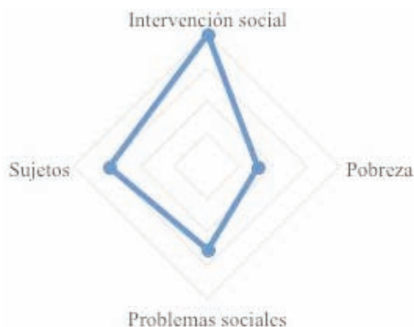
GRÁFICO 7: Exclusión social. Cruzamiento con las principales palabras clave. Valores sobre total