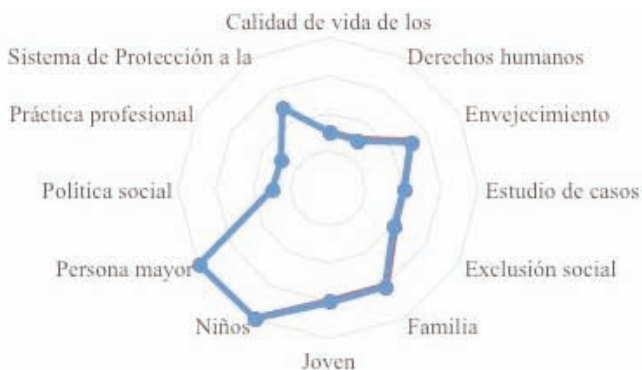
GRÁFICO 1: Intervención social. Cruzamiento con las principales palabras clave. Valores sobre total