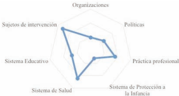
GRÁFICO 2: Trabajador Social. Cruzamiento con las principales palabras clave. Valores sobre total