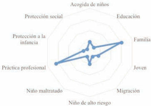
GRÁFICO 4: Niñez. Cruzamiento con las principales palabras clave. Valores sobre total