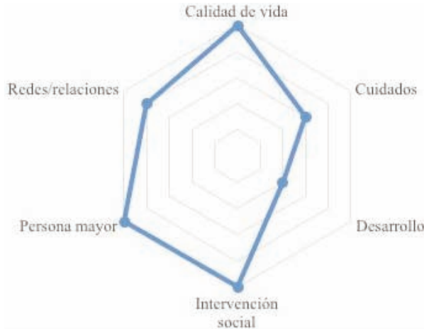
GRÁFICO 6: Envejecimiento. Cruzamiento con las principales palabras clave. Valores sobre total