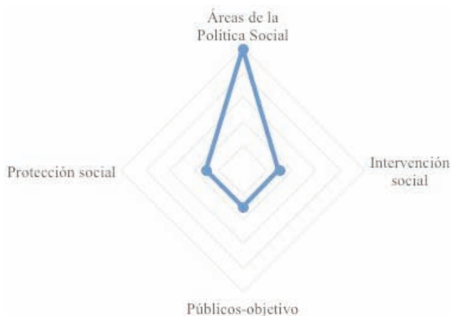
GRÁFICO 9: Joven social. Cruzamiento con las principales palabras clave. Valores sobre total