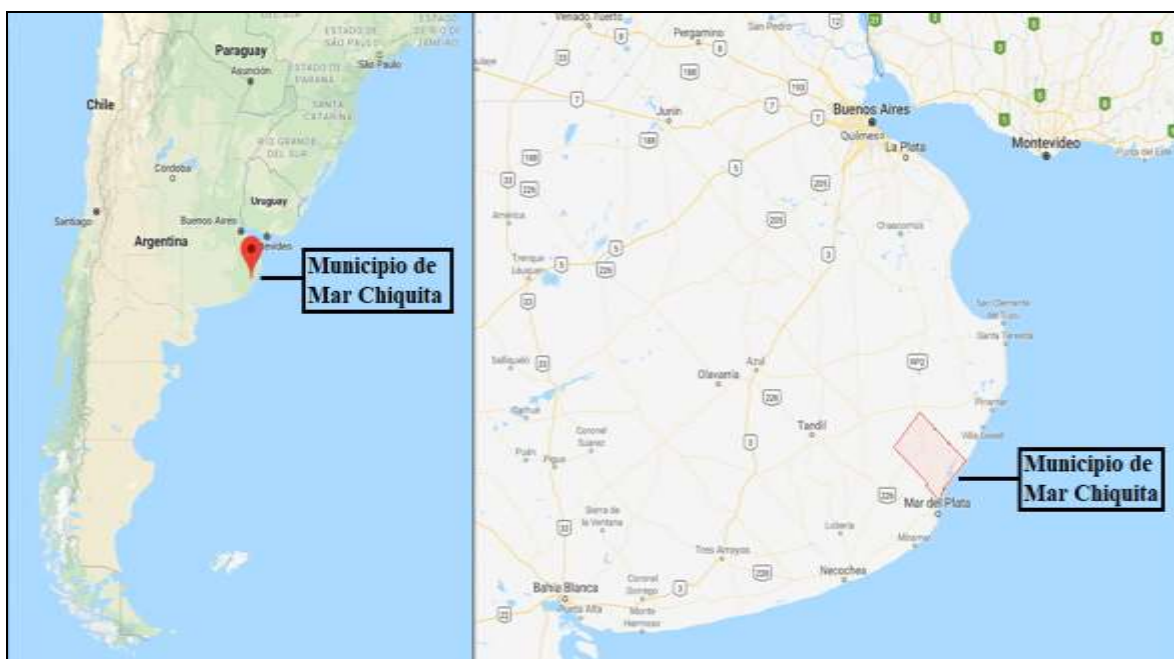
Figura 1 Ubicación del Partido de Mar Chiquita.

El Partido de Mar Chiquita se encuentra ubicado en la República Argentina, al sudeste de la provincia de Buenos Aires. Sus límites están comprendidos al sur por el Partido de General Pueyrredón, al oeste con los partidos de Balcarce y Ayacucho, al norte con los partidos de Maipú y General Madariaga, al noreste con el Partido de Villa Gesell y hacia el este con el Océano Atlántico. Se compone de seis localidades, tres de ellas ubicadas en la costa (Santa Clara del Mar, Mar de Cobo y Balneario Parque Mar Chiquita) y otras tres en el sector mediterráneo (Vivoratá, General Pirán y Coronel Vidal, esta última cabecera del Partido). A todas ellas se les suman otras urbanizaciones de menor escala como Santa Elena, Camet Norte y La Caleta, entre otras. Según el Instituto Nacional de Estadísticas y Censos (INDEC), la población total del partido para el año 2010 estuvo compuesta por unos 21.279 habitantes.