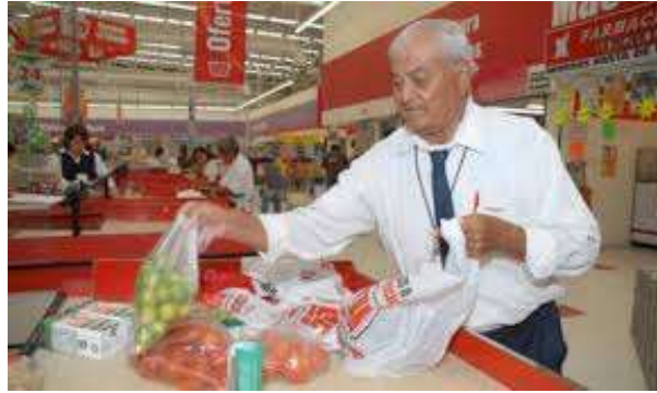
Figura 3. Muestra a un adulto mayor de empacador (cerillo) en un supermercado.

El Instituto Nacional de las Personas Adultas Mayores de México (INAPAM) desde 2012 publicó cuatro ejes fundamentales en temas de políticas públicas a favor de las personas adultas mayores, que consisten en: