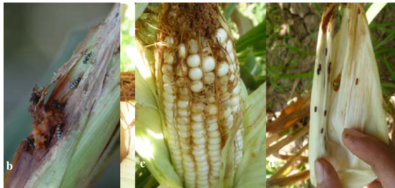
Figura 1. a) Moscas de los estigmas atraídas por el daño de gusanos en el fruto, b) Larvas de moscas alimentándose en puntas de frutos y granos adyacentes, c) Daños en el fruto y d) Pupas de moscas de los estigmas en hojas que envuelven a los frutos de maíz.