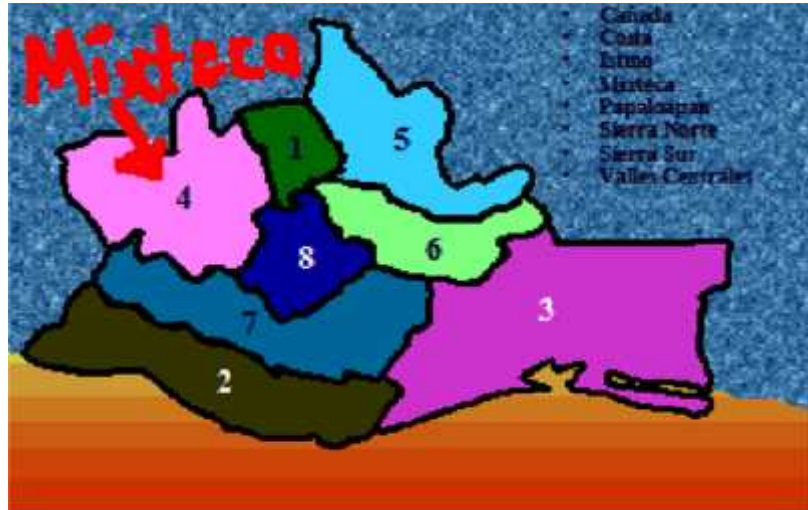
Figura 1. Ubicación de la región mixteca en el estado de Oaxaca.

Oaxaca está conformada por ocho regiones que por su extensión territorial se ordenan de la siguiente manera: Istmo, Mixteca, Sierra Sur, Costa, Sierra Norte, Valles Centrales, Tuxtepec o Papaloapan y Cañada. Los grupos étnicos que se encuentran en el estado son 16: amusgo, chatino, chinanteco, chocho, chontal, cuicateco, huave, ixcateco, mazateco, mixe, mixteco, náhuatl, triqui, zapoteco, zoque y popoloca.