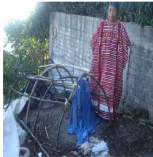
Fotografías representativas del trabajo de investigación en el orden de las manecillas de reloj: a) entrevista a médico alópata; b) hierba de Chichicastle; c) baño de temazcal triqui en San Andrés Chicahuaxtla, y d) Baño de temazcal mixteco en Santiago Yolomecatl.