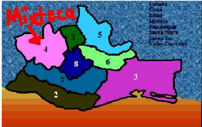
Figura 1.- Mapa 1. Ubicación de la región mixteca en el estado de Oaxaca.

chatino, chinanteco, chocho, chontal, cuicateco, huave, ixcateco, mazateco, mixe, mixteco, náhuatl, triqui, zapoteco, zoque y popoloca.