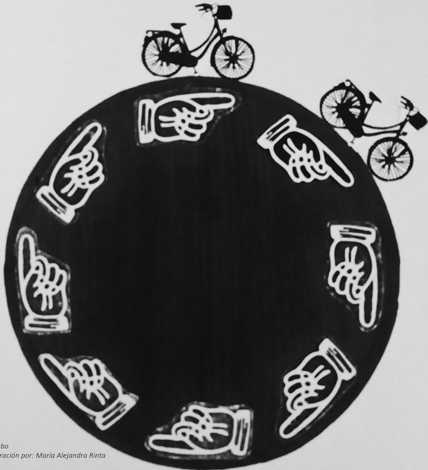
Rumbo Ilustración por: María Alejandra Rinta