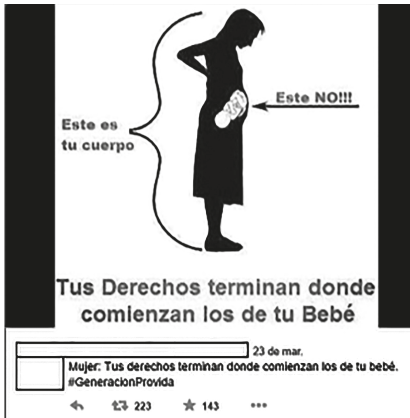
e. Tuit Unidos por la Vida.

En sus manifestaciones, comunicados y acciones la plataforma tilda de “lobby gay” o “lobby abortista” a quienes defienden los derechos sexuales y reproductivos, de manera que algunas de sus respuestas buscan atacar y desinformar sobre la postura de sus “enemigos” (Video: Alientan a firmar a favor de referéndum para revertir aborto en Colombia, 3 de julio de 2013; Líder pro vida de la plataforma, contacto vía skype, 27 de febrero de 2016). De esta forma, se definen por abanderar la causa de la vida mientras que esos otros (otras), que ubican en el lugar de una “minoría”, desde su perspectiva, están del lado de la muerte.