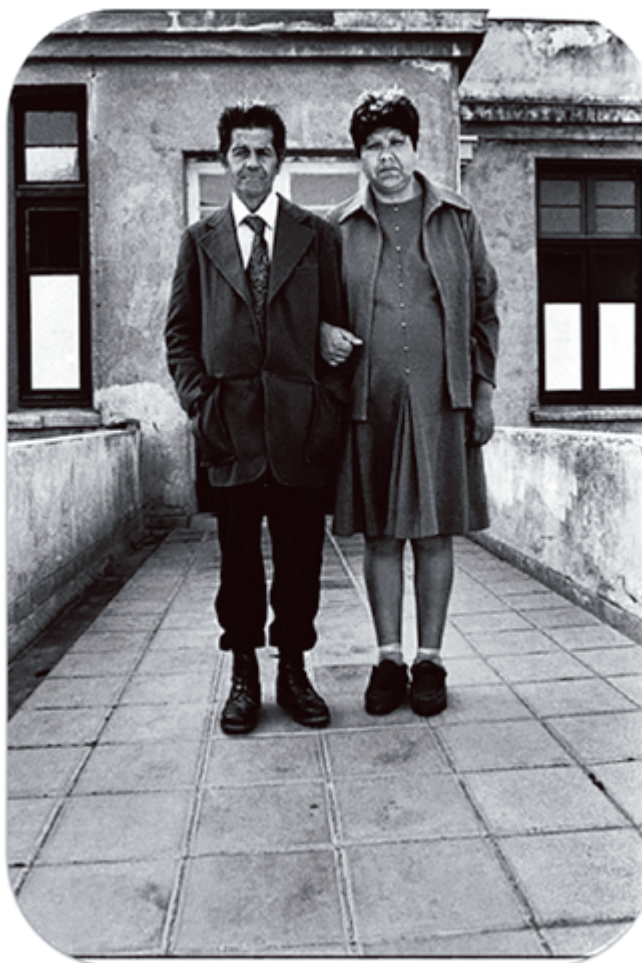
Imagen 2: (Eltit y Errázuriz, 2010, p. 6

Lo siamés en el texto se origina así desde un principio de desmonstrificación: no es lo grotesco, el miedo a lo diferente o la representación social del monstruo lo que prevalece en El