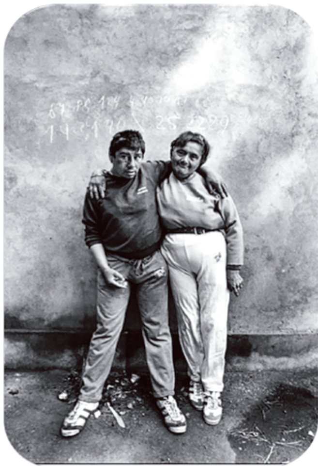
Imagen 1: Eltit y Errázuriz, 2010, p. 53

Más adelante, Ramos se refiere a este libro (¿foto-ensayo?) como una “colaboración entre la imagen documental y la palabra profundamente intensificada y fracturada por la pulsión estética. Colaboración y alianza de diferencias” (Ramos, 2012, p. 162), en la que precisamente, tanto la forma como el contenido y la ejecución del proyecto en sí mismo, con la alianza entre una escritora y una fotógrafa, produce un libro “siamés”.