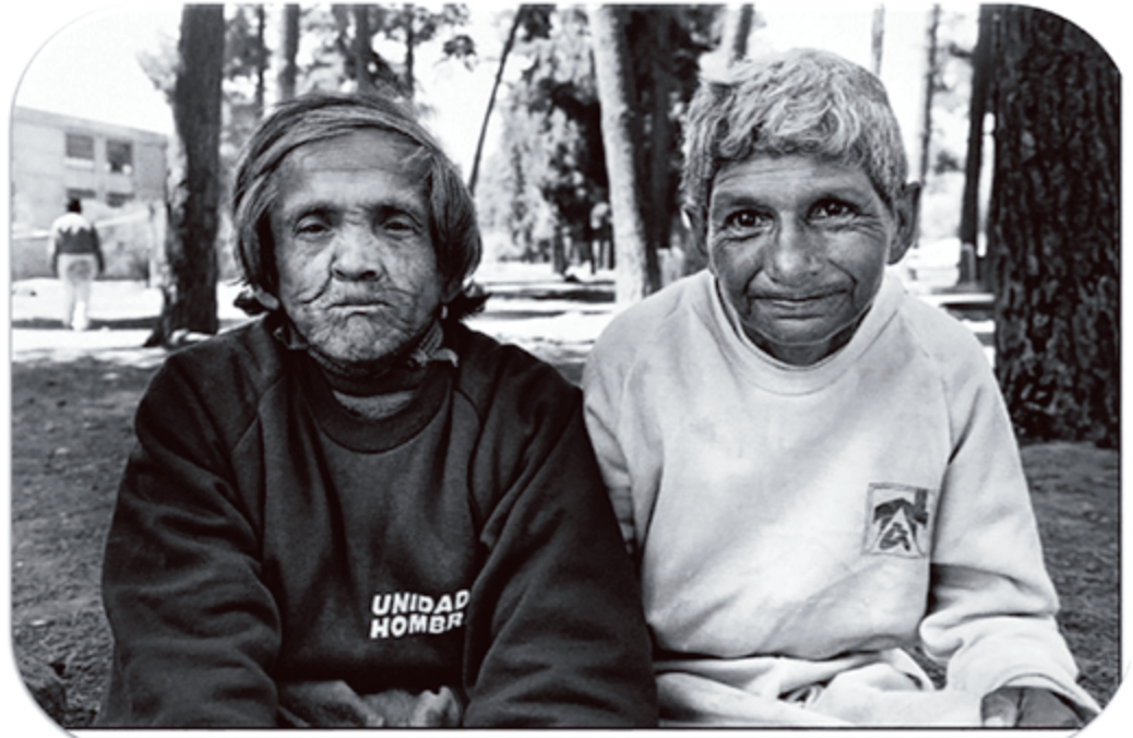
Imagen 4: Eltit y Errázuriz, 2010, p. 41