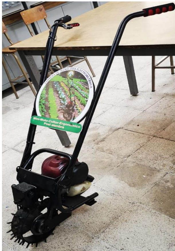
Figura 5. Prototipo mini motocultor.