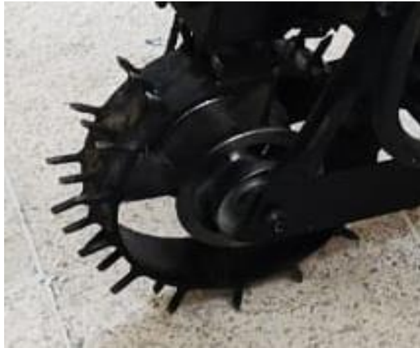
Figura 3. Rueda de tracción. Elaboración: Propia.