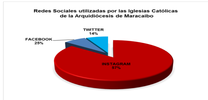
Gráfico 1. Redes Sociales utilizadas por las Iglesias Católicas de la Arquidiócesis de Maracaibo