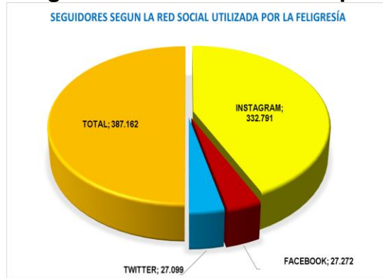
Grafico 3. Seguidores según la Red Social utilizada por la Feligresía

El gráfico 2 evidencia que el 35% de las iglesias publican entre 1 y 4 (post) a diario, mientras que el 41% no publica y agregan contenido a su historia 20%. Su contenido refiere a la palabra de Dios, Eucaristías, novenas, los evangelios y medidas de bioseguridad