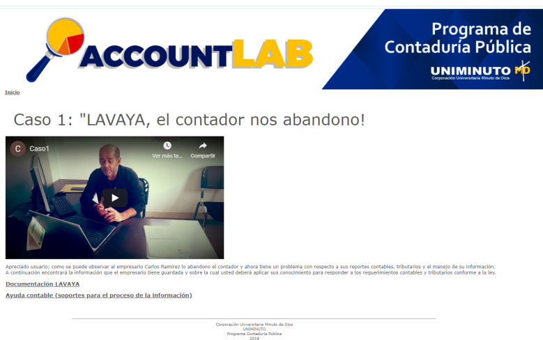
Figura 4 Caso propuesto laboratorio contable

Con la descripción del módulo y el listado de cada caso o situación problema, los casos estarán acompañados de un video en la que se simulación la situación por la que pasa los empresarios o las personas naturales en su vida cotidiana, la documentación que soporta la situación vivida por el protagonista del video y finalmente una herramienta en Excel que le permite el proceso de la información y la solución a esta situación ver figura 4.