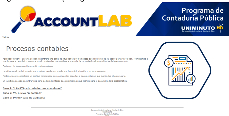
Figura 3 Modulo procesos contables

Dentro del módulo Procesos contables el estudiante al dar click en este ítem encontrará la siguiente interfaz (ver figura 3)