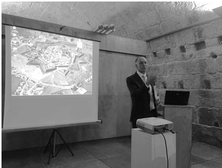
Acto de clausura. Intervención del Presidente da Câmara Municipal de Almeida.