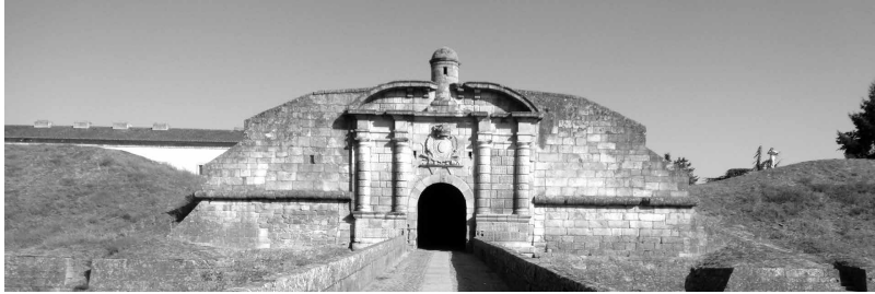
Portas de Santo António, Almeida, en cuyo interior se celebraron las VI Jornadas de Fortificaciones

Posteriormente, durante el día 30 de abril, se realizó una visita a diversos lugares de la fortaleza de Almeida, especialmente a su Museu Histórico-Militar, así como a otros lugares patrimoniales de los alrededores, entre los que debemos destacar la freguesía de Malhada Sorda (donde se inauguró una “esnoga” -sinagoga de culto “discreto” de los judíos expulsados de España por los Reyes Católicos y acogidos en la zona-, habilitada ahora como local cultural), en que actuó su Banda Filarmónica, y se recorrió la ciudad medieval fortificada de Castelo Mendo .