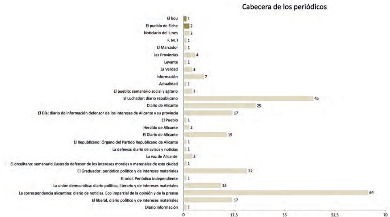
Gráfico. 2: Número de noticias aparecidas en sus respectivos periódicos.