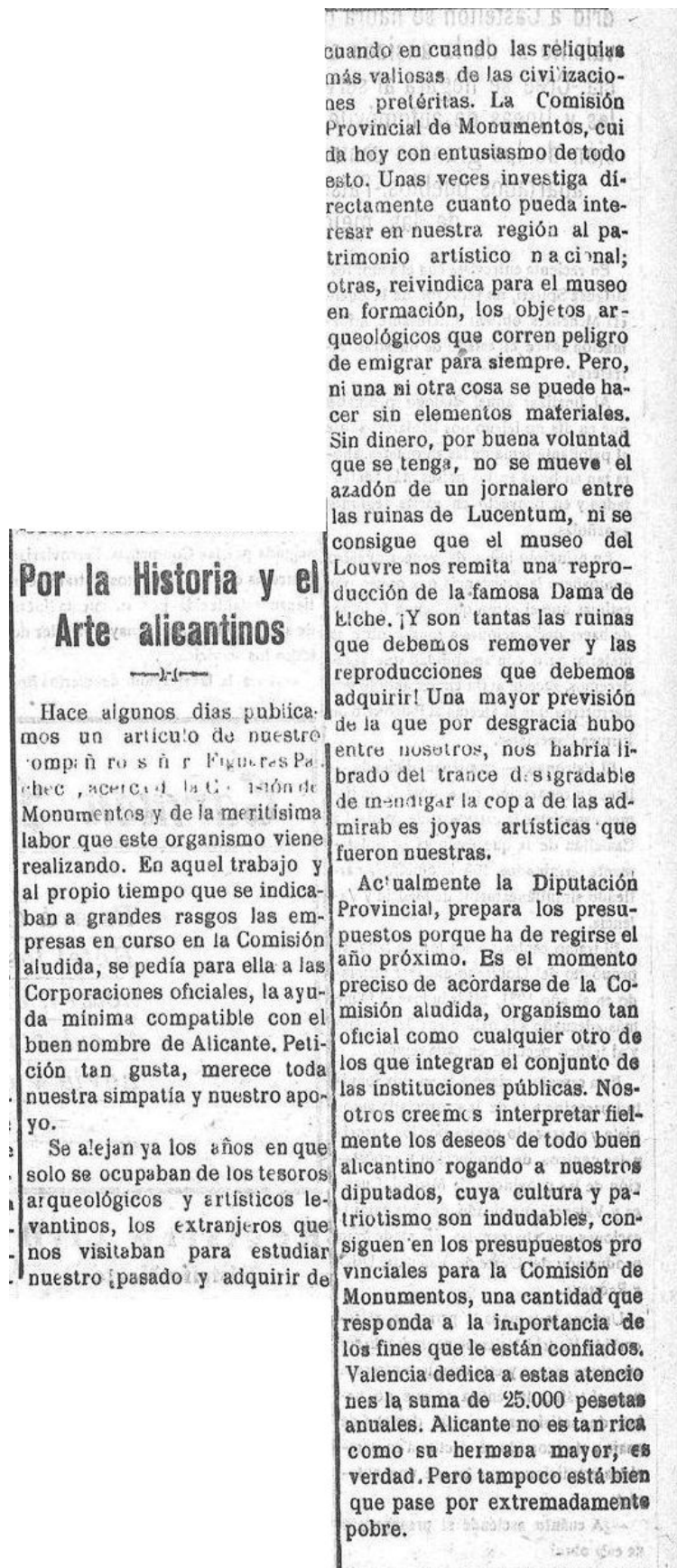
Figura 3: Diario de Alicante (05 de noviembre de 1929). Biblioteca Virtual de Prensa Histórica. Ministerio de Cultura y Deportes.