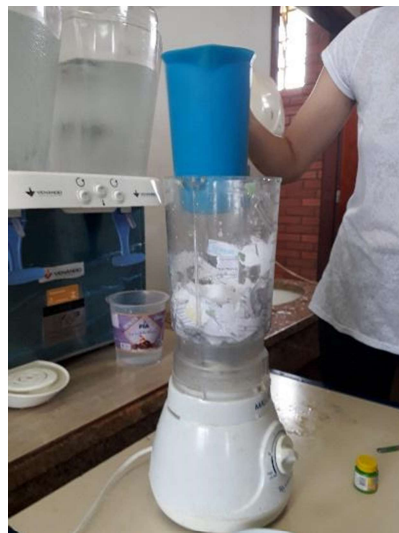
Figura 2 - Polpa de papel

Na segunda etapa da atividade, os papéis já picados foram mergulhados na água e triturados no liquidificador por 30 segundos, tempo suficiente para que a consistência do papel se tornasse pastosa, formando a polpa de papel (Figura 2). Nesse momento, os alunos puderam colorir as polpas de papel através de corantes, o que posteriormente dará cor ao seu “Papel Semente”.