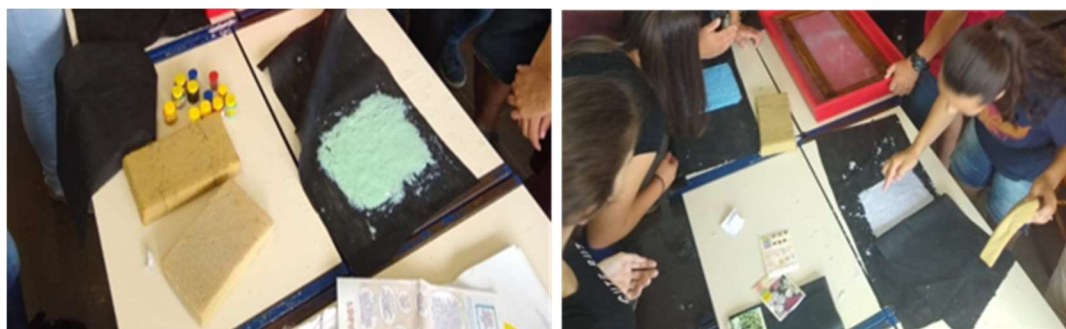
Figura 4 - Alunos moldando e acrescentando sementes ao papel.

Depois do escoamento inicial, empurrou-se o papel com delicadeza para retirá-lo da peneira e colocá-lo no TNT, onde foi moldado do tamanho desejado e, após, foram adicionadas ao papel as sementes escolhidas, sendo estas agrupadas de forma vertical em diferentes áreas do papel, separadas por tipo de hortaliça para que não se misturassem e para que fosse possível a identificação da semente quando fosse plantada (Figura 4).