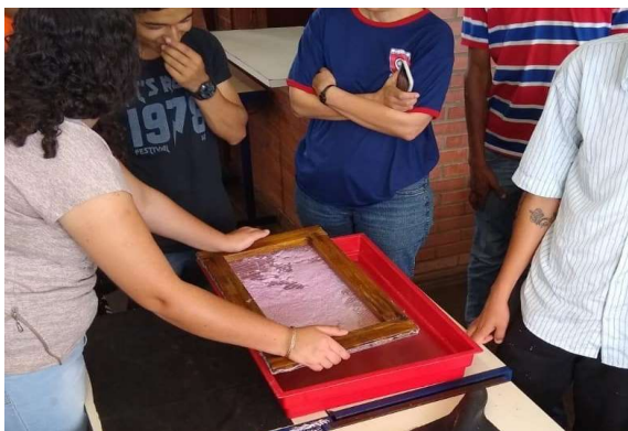
Figura 3: Escoamento do excesso de água.

No recipiente com água, foi posicionada a peneira e, logo em seguida, foi adicionada nesta a polpa de papel (obtida na primeira parte do processo), obtendo-se com isso o formato do papel reciclado. Posteriormente, a peneira foi retirada do recipiente para o escoamento do excesso de água (Figura 3).