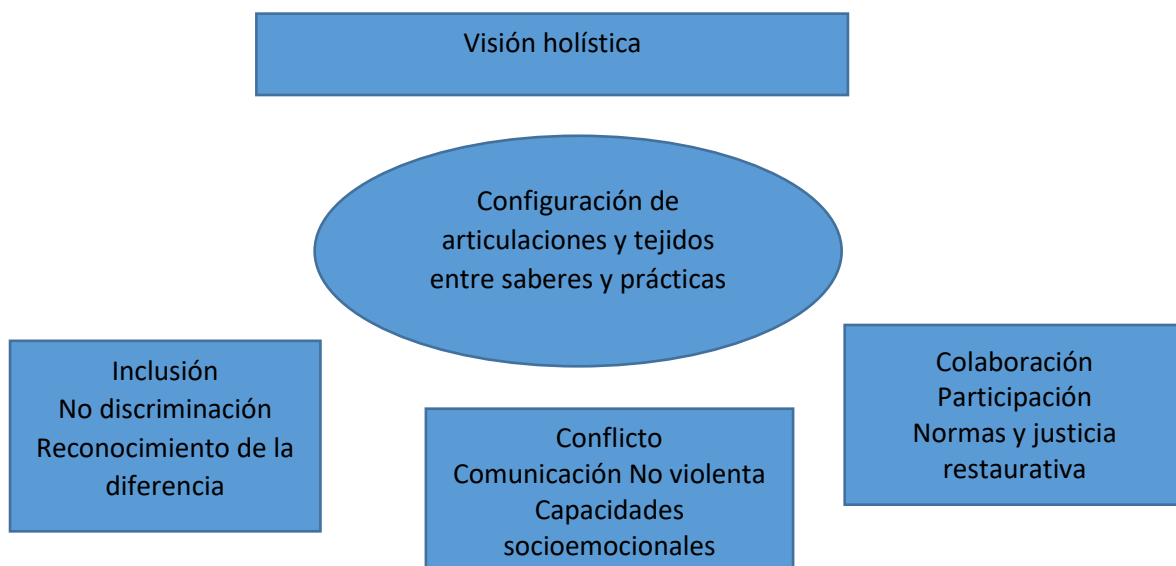
Figura 1. Abanico de rutas para afrontar las problemáticas de la gestión de la convivencia

Sin el afán de realizar una clasificación rígida de los campos temáticos que se identifican en los dispositivos elaborados por los egresados de la maestría, debido a los riesgos que dicha práctica entraña en términos del oscurecimiento de la posibilidad de comprender la singularidad de cada una de las experiencias, encontramos que las propuestas construidas focalizan sus esfuerzos en las nociones de conflicto, inclusión y participación como tres grandes nociones clave que articulan los ejes temáticos, alrededor de los cuales se ensayan vías para construir alternativas de educación para la paz transformativa: desde el desarrollo de capacidades para afrontar conflictos de manera pacífica, la mejora de los procesos de comunicación y la formación de capacidades socioemocionales como contenidos tradicionales de la educación para la paz hasta el desarrollo de experiencias orientadas a combatir la discriminación y promover el reconocimiento de la diferencia y procesos reales