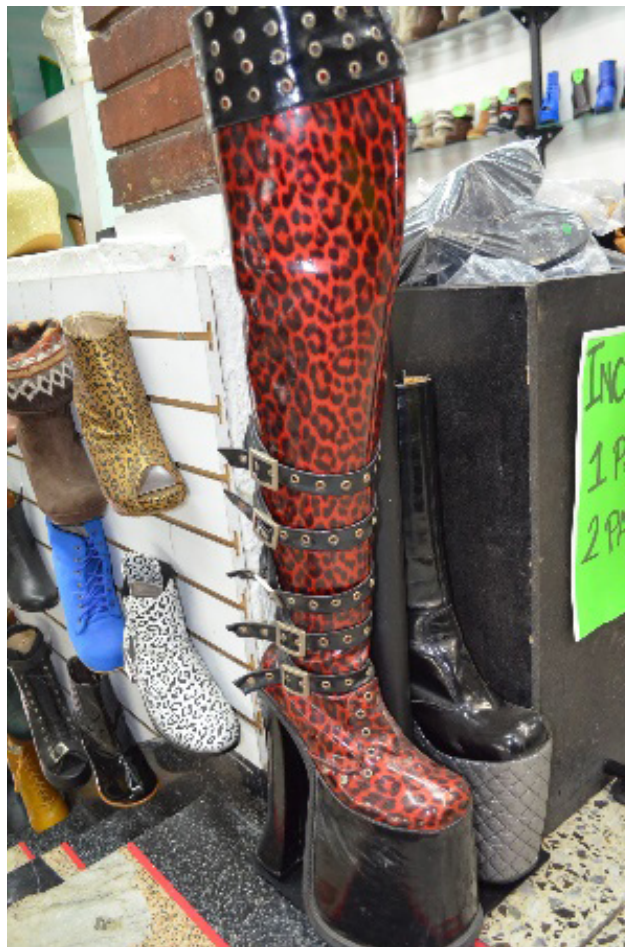
Figura 2. Zapatos drag queen

En los supermercados de los centros comerciales, la carne se ve maravillosa con la luz. Luego, en la casa, la persona que la ha comprado descubre que no tiene nada de especial. Es un espejismo: la carne es carne. Como la