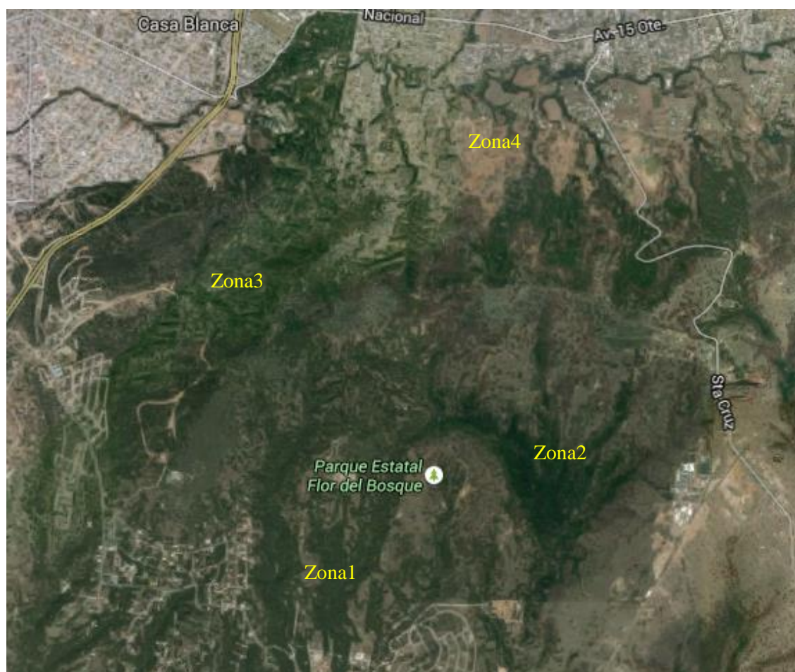
Figura 1.- Distribución de las zonas de muestreo en el parque “Flor del Bosque”.

ZN1: Zona pino, ZN2: Zona encino, ZN3: Zona eucalipto, ZN4: Zona pastizales