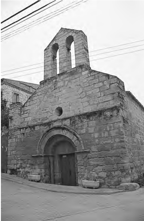
Església romànica de Sant Pere de Maldà

del patrimoni s'ha de tractar des de tres punts de vista: