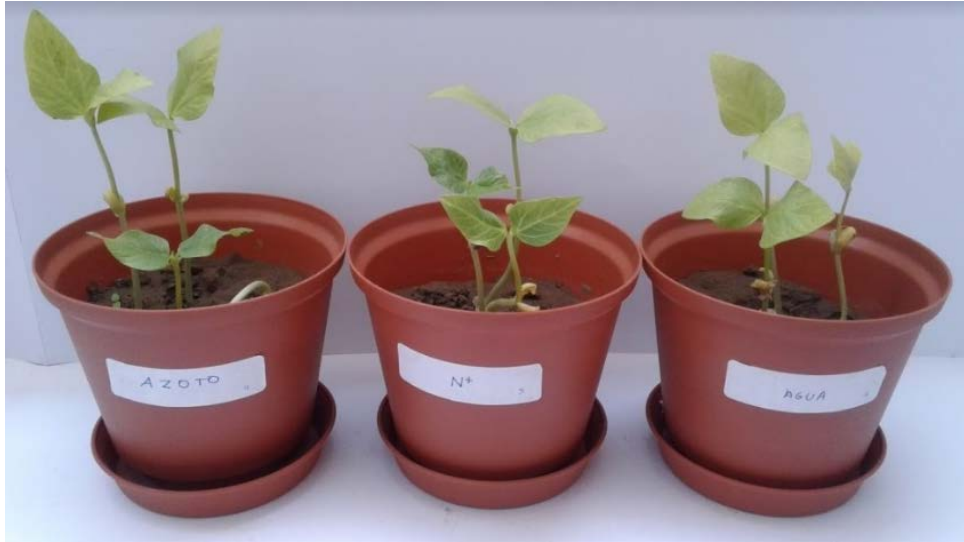
Figura 3. Gráfico comparativo de las plantas de frijol caupíen invernadero a los 15 días de evaluación, de izquierda a derecha Azotobacter , N+ y agua.