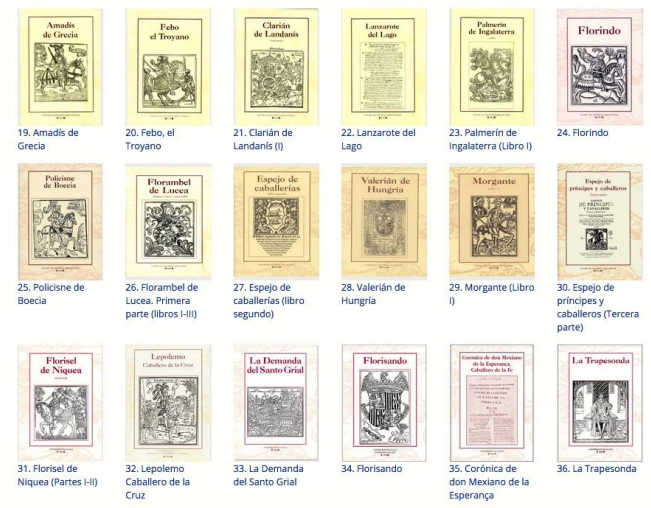
Figura 1: Libros de Rocinante