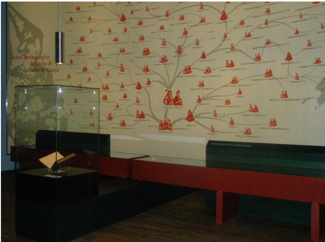
Figura 5: Árbol genealógico del ciclo de Amadís de Gaula