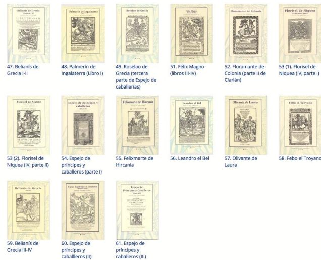
Figura 2: Guías de lectura caballeresca