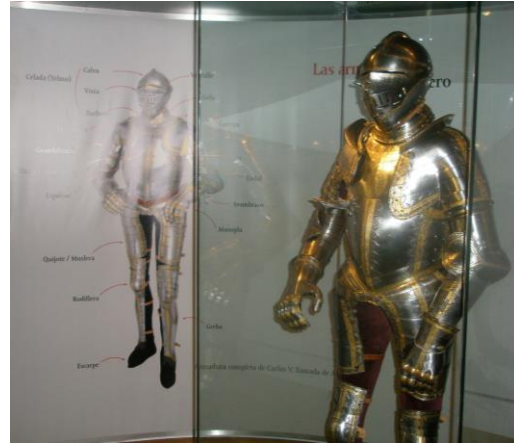
Figura 3: Réplica de la prensa del siglo XVI Figura 4: Armadura de Carlos V