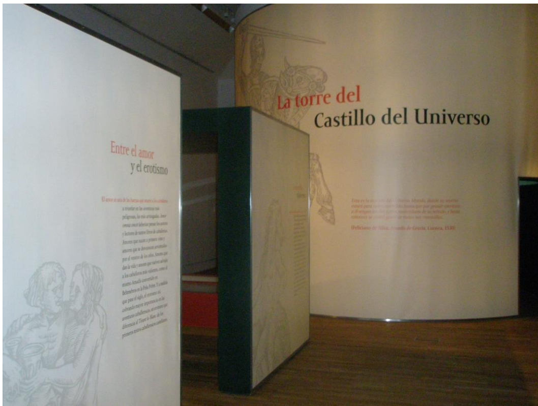
Figura 6: La Torre del Universo, visión externa

Esta es la morada del Universo Mundo, donde su secreto estará para todos escondido hasta que por grande aventura a él vengan los dos justos merecedores de su señorío, y hasta entonces se podrán gozar sus aposentos de todas sus maravillas.