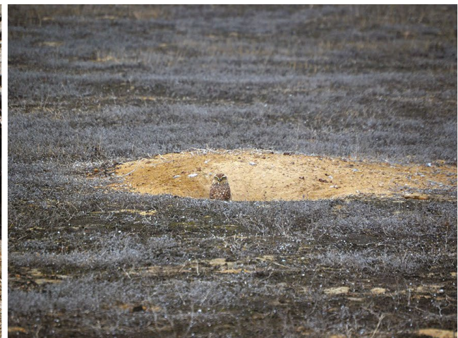
Figura 3. Guardias y polluelos de Athene cunicularia . A. En Barranca, Lima. B. En Reserva Nacional de Lachay, Lima.