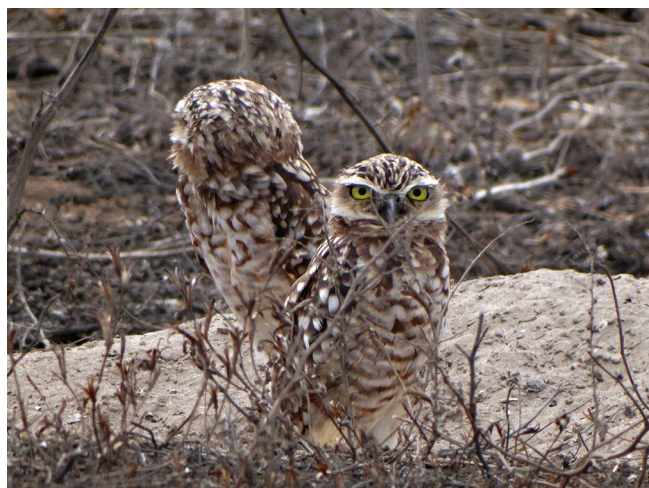
Figura 2. Athene cunicularia nanodes (Reserva Nacional Lachay, Lima).

Es muy abundante y generalmente habita zonas abiertas como pastizales, sabanas y estepas, zonas áridas y secas, como las lomas costeras, asociaciones de cactus o tilandsiales, también las playas de los ríos, humedales, en agroecosistemas; en la vertiente occidental y en los Andes muestra preferencia por las zonas rocosas y pedregosas; y también habita en áreas abiertas con poca cobertura vegetal sobre suelo arenoso donde construyen sus madrigueras (Pulido et al. 2007, Pulido et al. 2013).