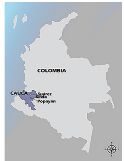
A Figura 2. Colombia. Departamento del Cauca. Municipios de Popayán, Silvia y Suárez. Localización general.