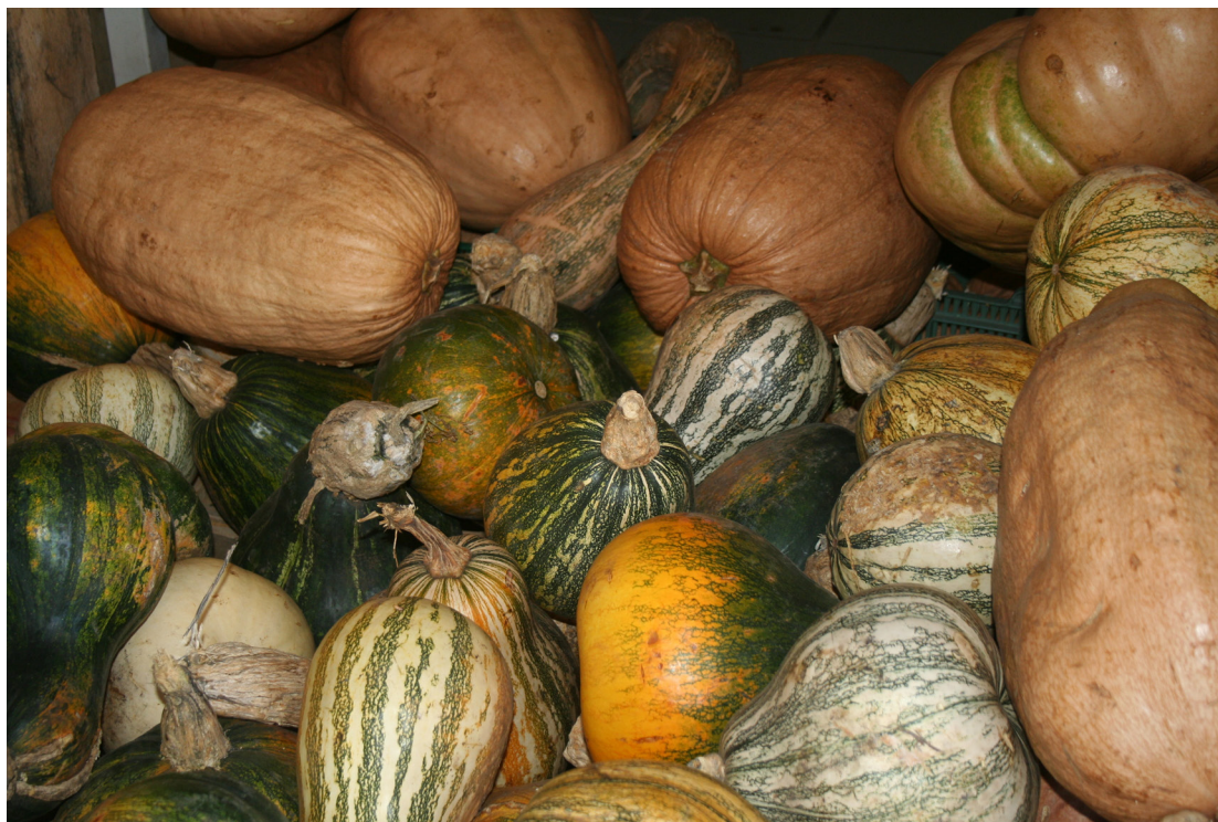
Figura 3. Diversidad morfológica observada en C. moschata (calabazas muy grandes de color beige o café claro que se aprecian en la parte superior de la fotografía) y C. argyrosperma (calabazas medianas de color verde con franjas o manchas bien marcadas, frutos generalmente en forma de pera con pedúnculos gruesos que se aprecian en la parte inferior de la fotografía).

domesticadas en México, tal vez miles de años antes que el maíz y el frijol, que después conformaron juntos la milpa. También se registraron restos de C. argyrosperma ssp. argyrosperma y C. moschata de más de 7 mil años, y de 6.9-5.5 mil años de antigüedad, respectivamente (Whitaker, 1981; Sánchez-de la Vega, 2017).