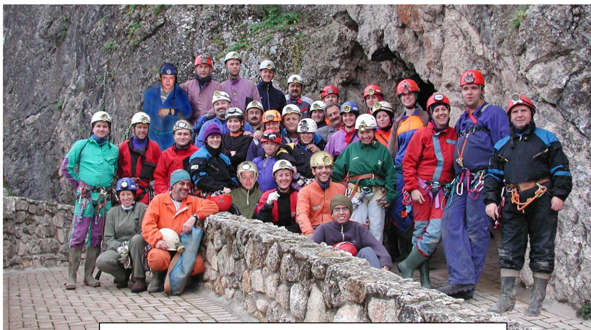
Miembros del G.E.G. en la entrada de la Cueva de las Ventanas 2007

Se han realizado dos campeonatos provinciales de progresión vertical y se continúa con los trabajos espeleológicos por toda la geografía granadina. El 31 de octubre de 2008 y tras un acuerdo asambleario la Sociedad Grupo de Espeleólogos Granadinos cambia de nuevo su denominación, volviendo a sus raíces, como Grupo de Espeleólogos Granadinos.