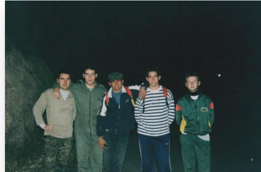
Cueva Blanca. Año 2000

Además de las numerosas cuevas que hemos hecho no hemos dejado de lado el barranquismo, siendo nuestro referente Río Verde, en el término municipal de Otívar, ya que nuestra proximidad es uno de los factores principales de visita. Ríos como el Lentegí, con sus distintas cabeceras, el barranco de la Sangre en la Tahá de Pitres, el barranco de la Adrada en Ávila, el barranco de Litueros en Madrid, el barranco de la Osera, en Villacarrillo, etc., son los que hemos realizado durante este tiempo, los cuales nos han servido para seguir aprendiendo de este deporte. Hemos realizado rutas de montañismo y senderismo, además de vías ferratas, tirolinas, puentes tibetanos, etc, lo que ha hecho sino fortalecer aún más los lazos entre los componentes del club. Como es natural el club ha tenido numerosas altas y bajas, pero aun así seguimos un buen número de personas y muchas de ellas desde los inicios del mismo.