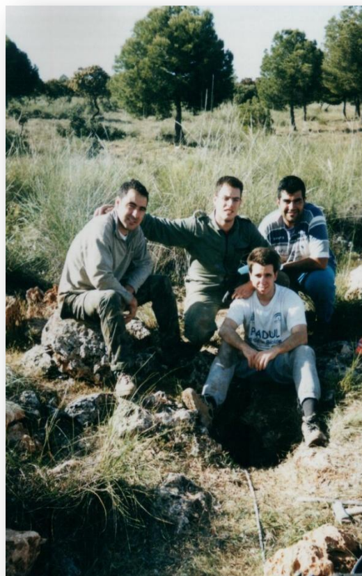
Sima de los Morrones. Año 2001

Otro de los hechos más importantes que realizó este club fue conseguir que Cueva Blanca no fuera derribada cuando hicieron las obras de la Carretera de la Cabra, en el término municipal de El Padul. Al final, más de diez años después, todavía podemos entrar a la cavidad. Esto nos valió el premio a la Conservación del Mundo Subterráneo, otorgado por el Club de Espeleología de Villacarrillo, a los cuales estamos muy agradecidos.