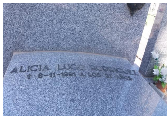
Fotografías realizadas el 10 de agosto de 2019.