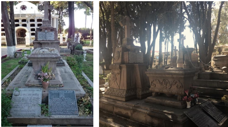
Fig. 5 SARCÓFAGO de Manuel Ascencio Padilla (Siglo XIX)

El sarcófago presenta sables cruzados con ramos de rosas y hojas en las molduras, también estrellas en sus laterales sobre una plataforma se posa un cofre con patas de león y ornamentación de hojas, poseyendo un coronamiento en el cuerpo por una cruz trebolada sobre una base de dos cuerpos con ornamentación acanalada.