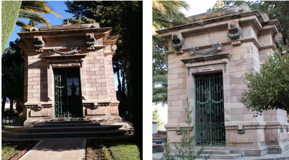
Fig. 7 MAUSOLEO de Aniceto Arce

Narciso Campero. Nació un 29 de octubre de 1813 en el pueblo de tojo luego a ser un estadista notorio que luego al poder llegando a perjudicar el reclamo marítimo, falleció un 11 de diciembre de 1896. Fue el tercer hombre más rico de la minería en Bolivia, participo de las batallas de Ingavi y de Iruya.