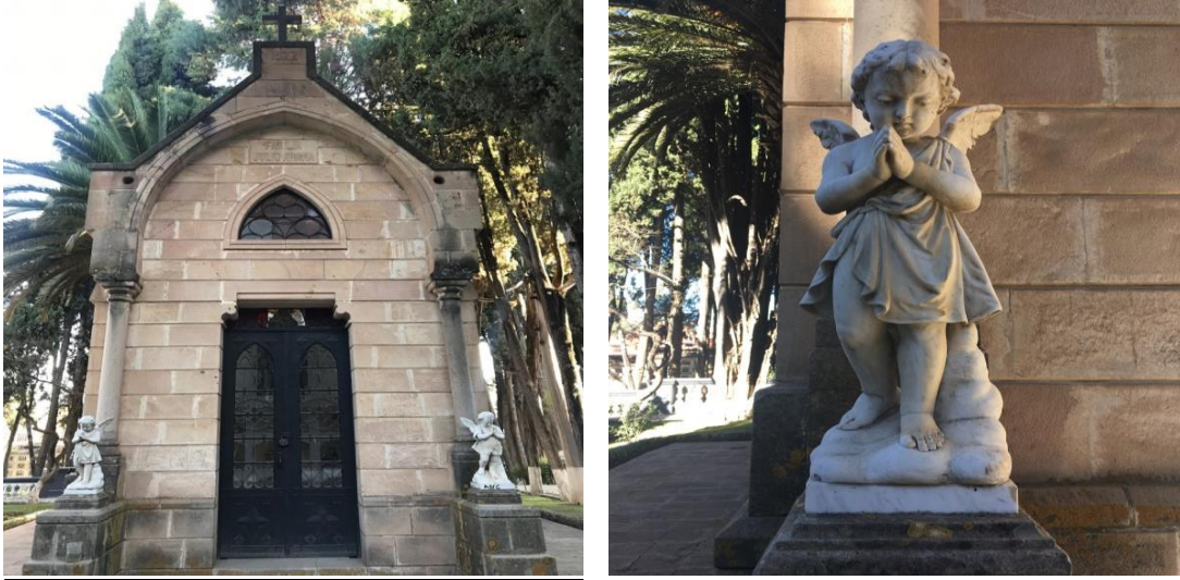
Fig. 12 MAUSOLEO de Familia Arana (Siglo XIX)

Mausoleo familia Arana, de una sola planta escoltado por dos angelitos de mármol exentos del mausoleo, ubicados simétricamente; sobre el vano central se encuentra un arco ojival acanalado encerrando un arco mayor también ojival cuyo remate es piramidal con un coronamiento de cruz latina.