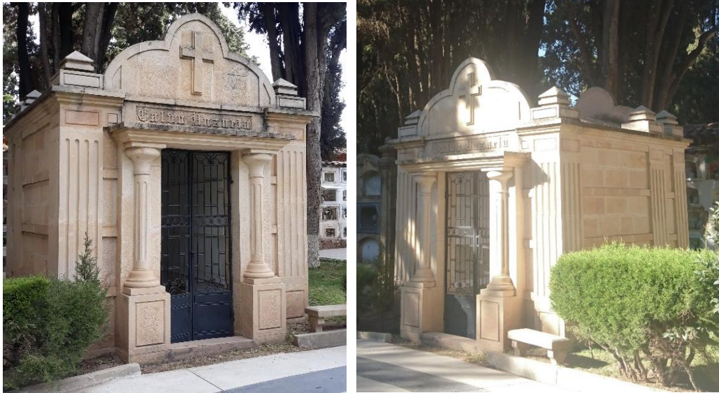
Fig. 14 MAUSOLEO de Familia Calvo Unzueta (Siglo XX)

Mausoleo familia Calvo Unzueta, presenta una sola planta con pilares acanalados y vano central rectangular, flanqueado por dos columnas adosadas a una pilastra simple con dintel escalonado en cuyo coronamiento presenta un arco trebolado con una cruz latina en la parte central.