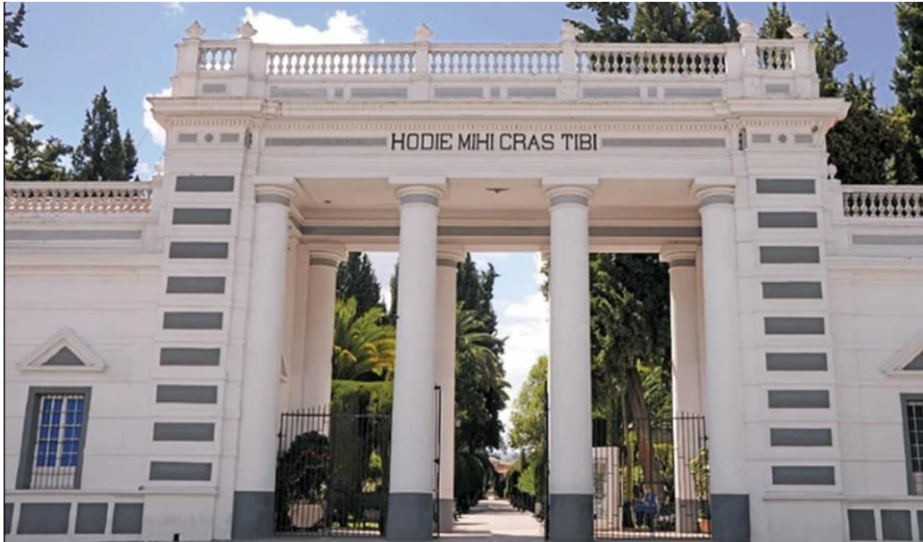
Figura 1: Fachada principal del Cementerio General de Sucre

El Cementerio General de Sucre se encuentra en la parte alta de la ciudad, donde sus centenarios pinos se asoman por encima de las paredes, ubicada sobre la calle José Manuel Linares y Regimiento Jordán, Distrito 02, Manzano 30, zona de preservación intensiva de la ciudad de Sucre, de acuerdo a la delimitación de la ciudad.