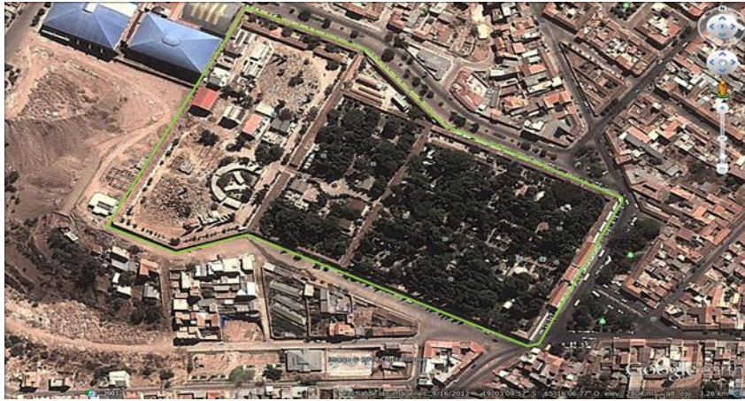
Fig. 20 Imagen Satelital del Cementerio de Sucre y delimitación de área

Es por este cometido y de acuerdo a la Carta de Florencia sobre “Jardines Históricos” (ICOMOS, 1980) y a las características de la ciudad de Sucre, consideramos que el cementerio patrimonial independientemente de brindar un lugar de memoria, pertenencia social, cultural; es considerado por la ciudadanía y visitantes como un pulmón verde de la ciudad, siendo que este espacio concentra grandes cantidades de vegetación en su composición paisajística y arquitectónica, desde el punto de vista de los jardines históricos, el interés público que genera y la salvaguarda que se tiene a este espacio a diferencia de lo que sucede con los espacios públicos que cuenta la ciudad de Sucre y el principal parque Bolívar. Constituyéndose estos dos espacios como las principales fuentes de vegetación y esparcimiento de la ciudadanía.