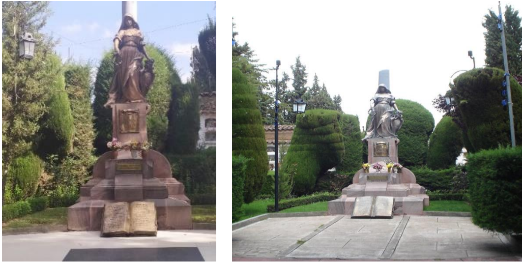
Fig. 10 MONUMENTO Guerra Federal