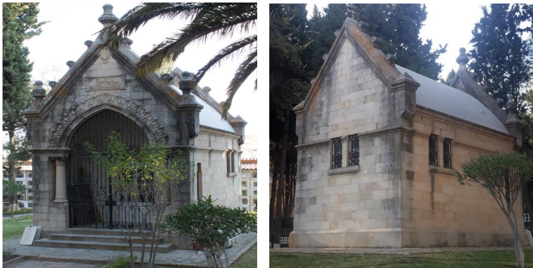
Fig. 13 MAUSOLEO de Familia Argandoña (Siglo XIX)

Mausoleo familia Argandoña, de una sola planta presenta un acceso escalonado que conduce al ingreso principal rematando en un arco ojival con ornamentación recargada, flanqueado por dos columnas con capitel corintio, la cubierta remata en forma triangular llevando ornamentación de roleos teniendo como coronamiento un pináculo.