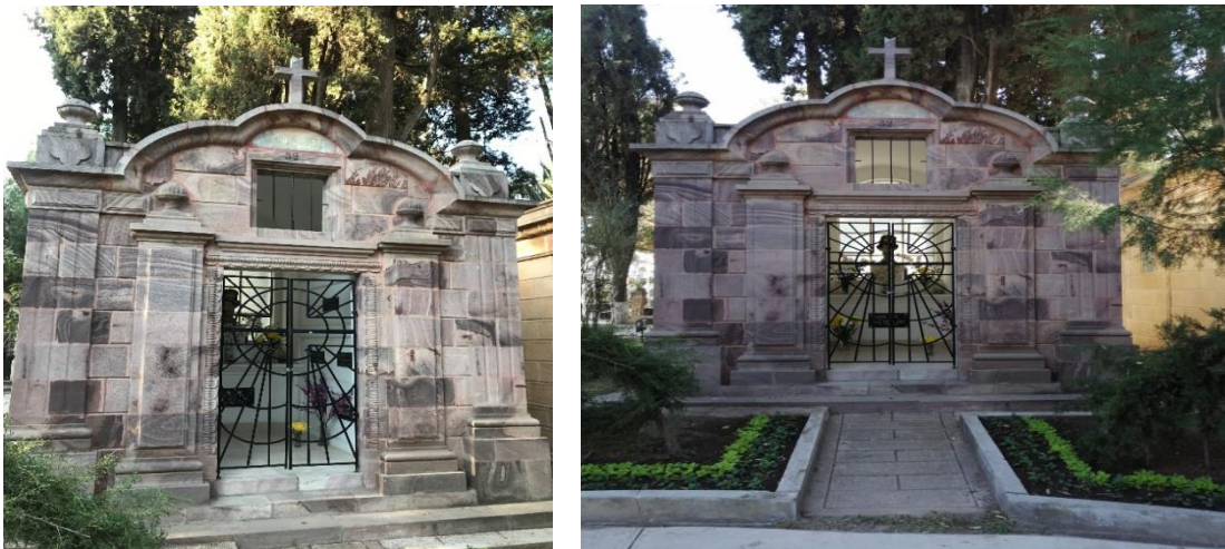
Fig. 15 MAUSOLEO de Familia Arce (Siglo XIX)

Mausoleo familia Arce, presenta una sola planta trabajada en piedra cortada, presentando un vano central rectangular enrejado, flanqueado por pilastras, adosada a esta se encuentra otro cuerpo a escala mayor con entablamento corrido, en la parte superior del vano tiene un coronamiento con cruz latina sobre arco trebolado a sus laterales dos dados con remate de maceteros.