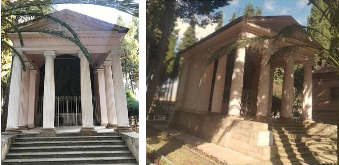
Fig. 9 MAUSOLEO de Gregorio Pacheco

aproximadamente 50 mil libras esterlinas. Y al morir, dejó su casa como centro psiquiátrico en honor a su nuera, que falleció con una enfermedad mental que la llevó a la locura.