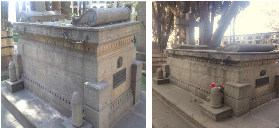
Fig. 8 CRIPTA de Narciso Campero

Narciso Campero. Nació un 29 de octubre de 1813 en el pueblo de tojo luego a ser un estadista notorio que luego al poder llegando a perjudicar el reclamo marítimo, falleció un 11 de diciembre de 1896. Fue el tercer hombre más rico de la minería en Bolivia, participo de las batallas de Ingavi y de Iruya.