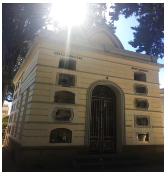
Fig. 17 MAUSOLEO Hnas. Carmelitas hijas de Santa Ana Hnas. Clarisas Adoratrices (Siglo XIX)