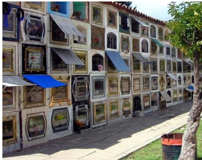
Fig. 19 SEPÚLCROS

El cementerio general, alberga innumerables tumbas escondidas detrás de santuarios de vidrio que están llenos de fotos, flores y objetos queridos por los fallecidos. Las familias generalmente están separadas dentro del cementerio: hay una sección separada para niños y adultos que se asignan a cualquier "nicho" disponible en ese momento.