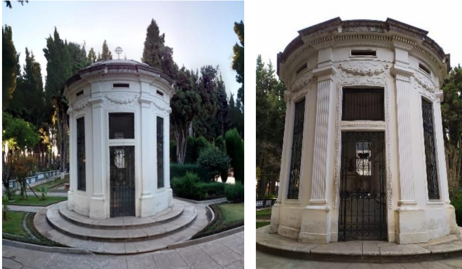
Fig. 3 MAUSOLEO de los Príncipes de la Glorieta - Familia Argandoña (Siglo XIX)

“Se dice que ellos traen el primer automóvil desde Europa, época de finales de 1800; ya que en esa época se andaba en carretones”. Esta pareja fue la creadora del banco Francisco Argandoña, que actualmente forma parte del Banco Nacional de Bolivia.