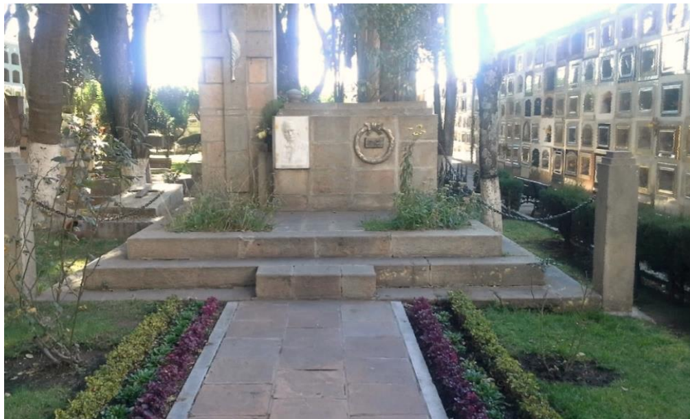
Fig. 2 CRIPTA de Hernán Siles Reyes

Siles Reyes sobresale en la historia boliviana por ser autor del Código Civil Penal y creador de la Contraloría del Estado. También promulgó la Ley del Día de la Madre y fue impulsor de la autonomía universitaria.