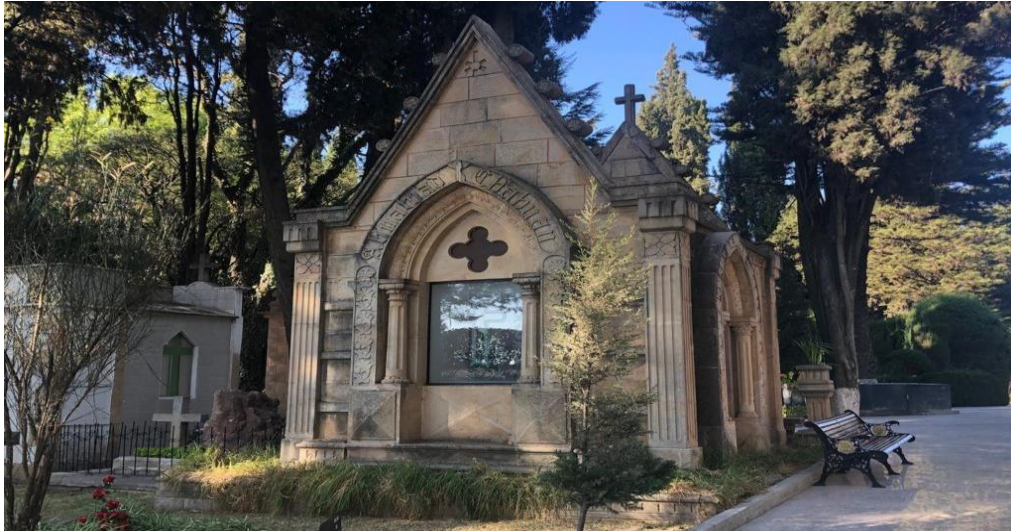
Fig. 18 MAUSOLEO Familia Abuaman Chabuan

Este mausoleo presenta una portada con características ojivales, con ornamentación floral y follajería exuberante, en la parte central y superior del vano con vidrio grabado tiene un lucernario en forma de cruz latina, este cuerpo es flanqueado por pilastras acanaladas cuya cubierta termina en forma triangular con remate de roleos y cruz latina.