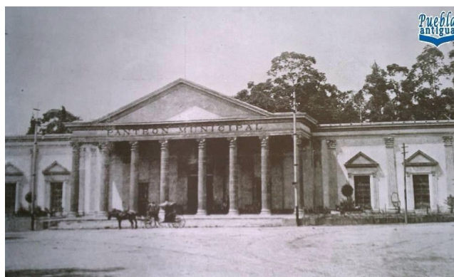
Figura 5. Panteón municipal en la Puebla Antigua https://www.google.com/search?q=panteon+municipal+fotos+antiguas

En 1881 se elaboró un Reglamento para el nuevo cementerio municipal, que contemplaba diversas instrucciones que debían ser respetadas por las autoridades que administraban el nuevo espacio funerario. Al entrar al nuevo siglo, el Panteón Municipal (fig.) era el recinto en el que se daba sepultura a poco más del 80%, el resto se distribuía entre el cementerio del pueblo-barrio de San Baltasar, El panteón de La Piedad y el Panteón Francés, estos últimos también urbanos.