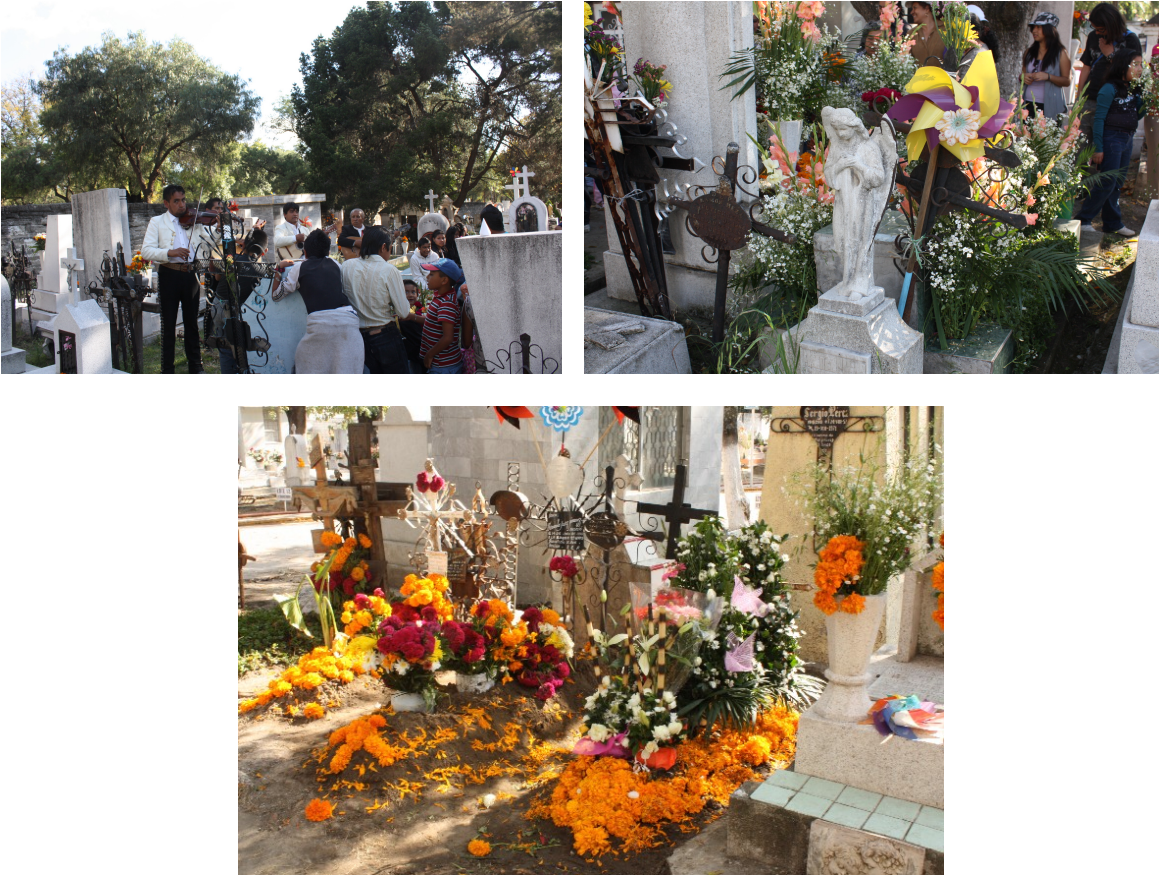
Figura 10 a-b-c. Presentes en la tradición del 2 de noviembre (MCV, 2017)

¿Qué hacer para recuperar y conservar este trabajo de forja manifestado en las cruces del Panteón Municipal?, es la pregunta que debiera guiar este trabajo, sin embargo la hemos dejado a manera de conclusión.