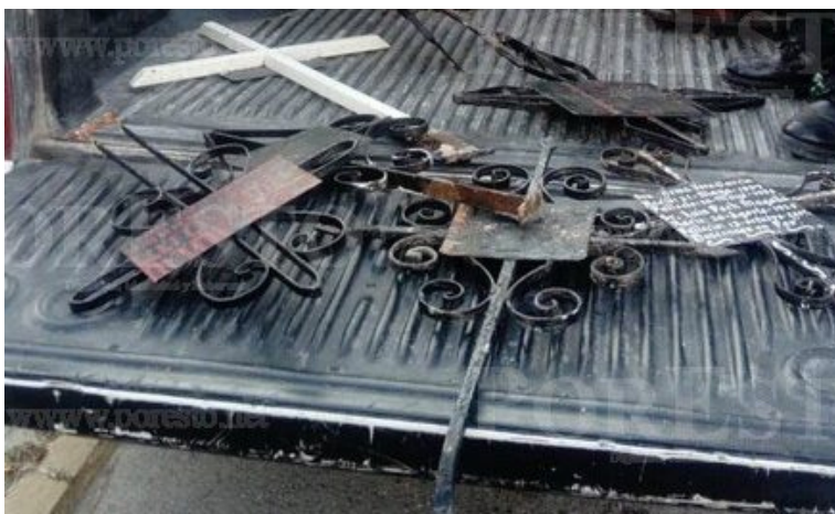
Figura 2. Cruces listas para la venta https://www.porestonet.net/2019/03/18/roba-cruces-del-cementerio/

Diversos materiales se han utilizado para estas representaciones que contienen diferente tipo de ornamentación, en este caso el objeto de estudio es el Panteón Municipal de la ciudad de Puebla y el sujeto será la cruz de hierro forjado que a la fecha es un elemento destinado a desaparecer, por un lado su desuso en los enterramientos y por otro que han sido motivo de robo. “Con la filosofía de que ya no le sirve a los muertos bien puede beneficiar a los vivos”) se dedican a robar las cruces metálicas de los panteones. A pesar de la vigilancia en ellos se dan maña para arrancar las cruces y venderlas posteriormente como fierro viejo en las chatarrerías. ( https://www.porestonet.net/2019/03/18/roba-cruces-del-cementerio/ )