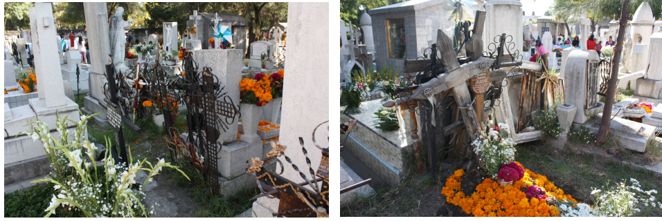
Figura 11a-b. Sucesión de cruces

En México es tradición, que se “pare la cruz” a los 9 días del evento y posteriormente al año y así sucesivamente en algunos casos, tradición que se ha ido perdiendo en los ámbitos urbanos, sumado a las cremaciones que al momento es una de las maneras de concluir con la presencia terrenal, pero...así es que encontramos en un solo enterramiento numerosas cruces colocadas sucesivamente.