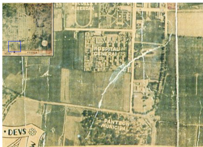
Figura 3. Panteón Municipal de Puebla (1937) ( http://www.fotosdepuebla.org/index.php?option=com_wrapper&Itemid=67 )

Se reporta que en 1877 se comenzó a buscar un sitio para establecer el cementerio municipal de la ciudad, y en septiembre de ese año el Ayuntamiento lo ubica en un terreno