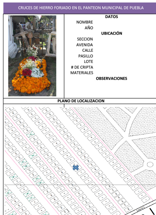
Figura 12. Ficha de inventario de cruces de hierro forjado

Regresando al cuestionamiento, las cruces previa ubicación se podrían clasificar cronológicamente apoyándose en los datos que contienen, también identificarse con sus destinatarios y clasificarlas de acuerdo a estilos y tipologías