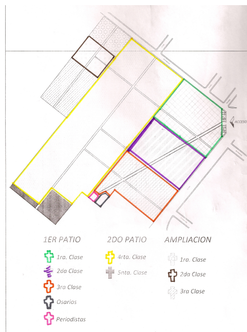
Figura 7. Croquis del cementerio municipal y sus distintas clases (MJ, 2011)

A la fecha esta dividido en 3 zonas que denominan: 1er. Patio y comprende la 1º, 2ª, 3º, clase, los osarios y la zona de periodistas, el 2º Patio comprende la 4ª y 5ª clase y en la ampliación se encuentra la 1ª, 2º y 3º clase.