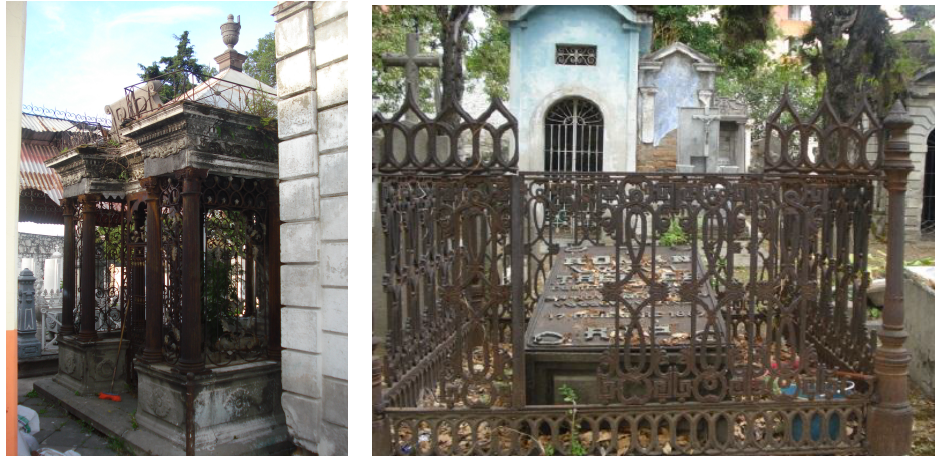
Figura 8. Uso de hierro forjado en diversas tipologías de enterramientos (MCV, 2017)

El trabajo de hierro forjado se ha manifestado en puertas-rejas de capillas, rejas que circundan sepulturas y cruces y como se escribió líneas arriba algunos “herrajes franceses” también.