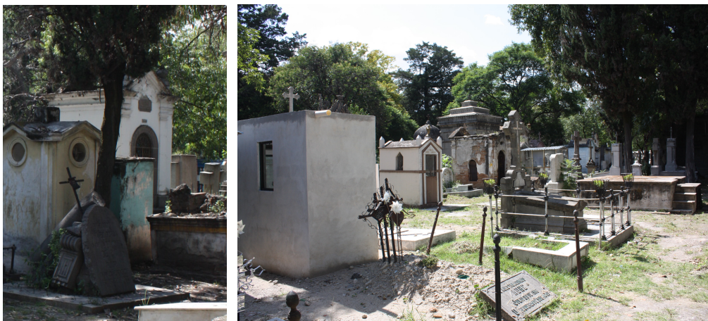
Figura 9. Cruz de abandono! (MCV, 2017)

Algunas de las cruces llevan las iniciales del difunto soldadas entre los adornos, pero la mayoría identifican al sujeto en placas de metal. Sin embargo, la cruz de hierro forjado denota un elemento del arte funerario, considerado como tal por el trabajo que los artesanos realizaron en algún momento siendo parte de la historia del panteón, y a la vez muestra en algunas ocasiones el abandono por parte de los familiares. A pesar de todo las cruces existentes todavía se pueden contar por varios cientos.