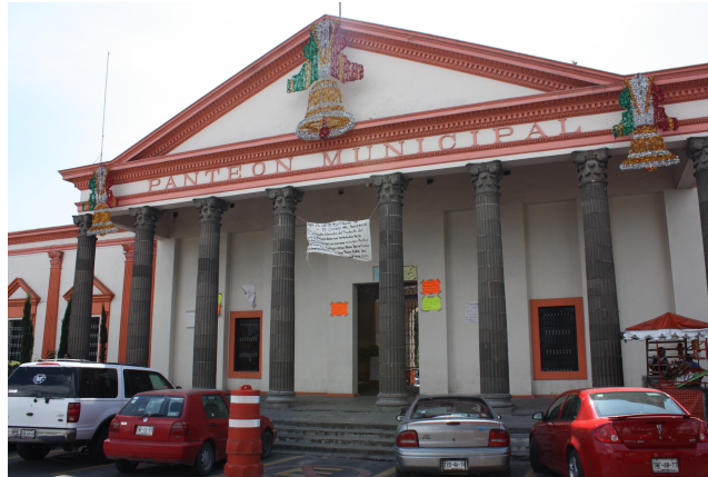
Figura 6. Panteón Municipal de Puebla en la actualidad (MCV, 2017)

El crecimiento del panteón fue estable y constante, hay 300 tumbas catalogadas por el Instituto Nacional de Antropología e Historia (INAH) como monumentos históricos. Su catalogación es debido a que éstas poseen herrajes franceses o esculturas importantes que datan del siglo XIX.