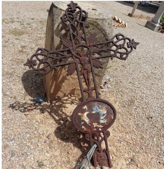
Figura 2. Las cruces de hierro forjado, un reflejo de la historia del espacio funerario

http://www.orienteteerno.org/2012/04/arnedillo-y-sus-cruces-de-hierro-i.html