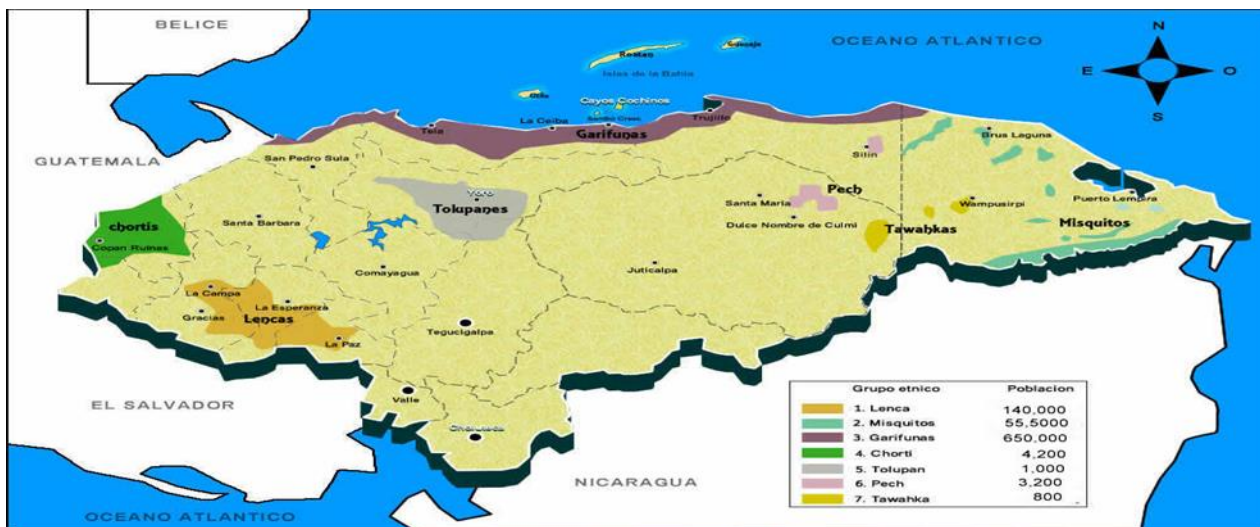
Mapa de Honduras, ubicación geográfica de los departamentos 3

Y la cultura de los Tolupanes lo ubicamos geográficamente en varias comunidades, municipios, departamentos de Honduras, Honduras es un país muy grande y natural muy montañoso, tiene bonitos valle, lagos, ríos, tiene 18 departamentos, 298 municipios actuales, pues vamos a ubicar a esta cultura en primer lugar los ubicamos en el departamento de Yoro, Francisco Morazán.