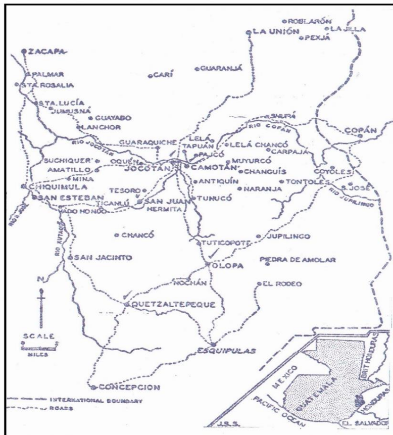
Mapa del área lingüística chortí.

En los siglos XVI y XVII, este mismo territorio formó parte del corregimiento de Chiquimula de la Sierra, que directamente tuvo influencia o control político religioso sobre las comunidades asentadas en la Cuenca en referencia.