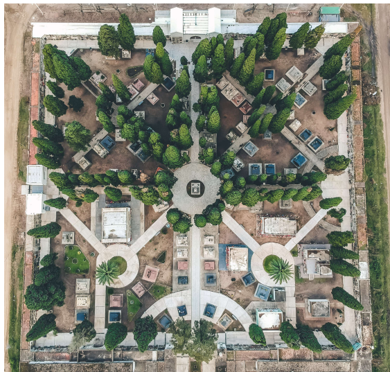
Foto aérea de la zona inicial del cementerio de Durazno y su área de trabajo definida. Foto de Javier Villasuso .

Acceso al cementerio, foto Arq. E. Montemuiño