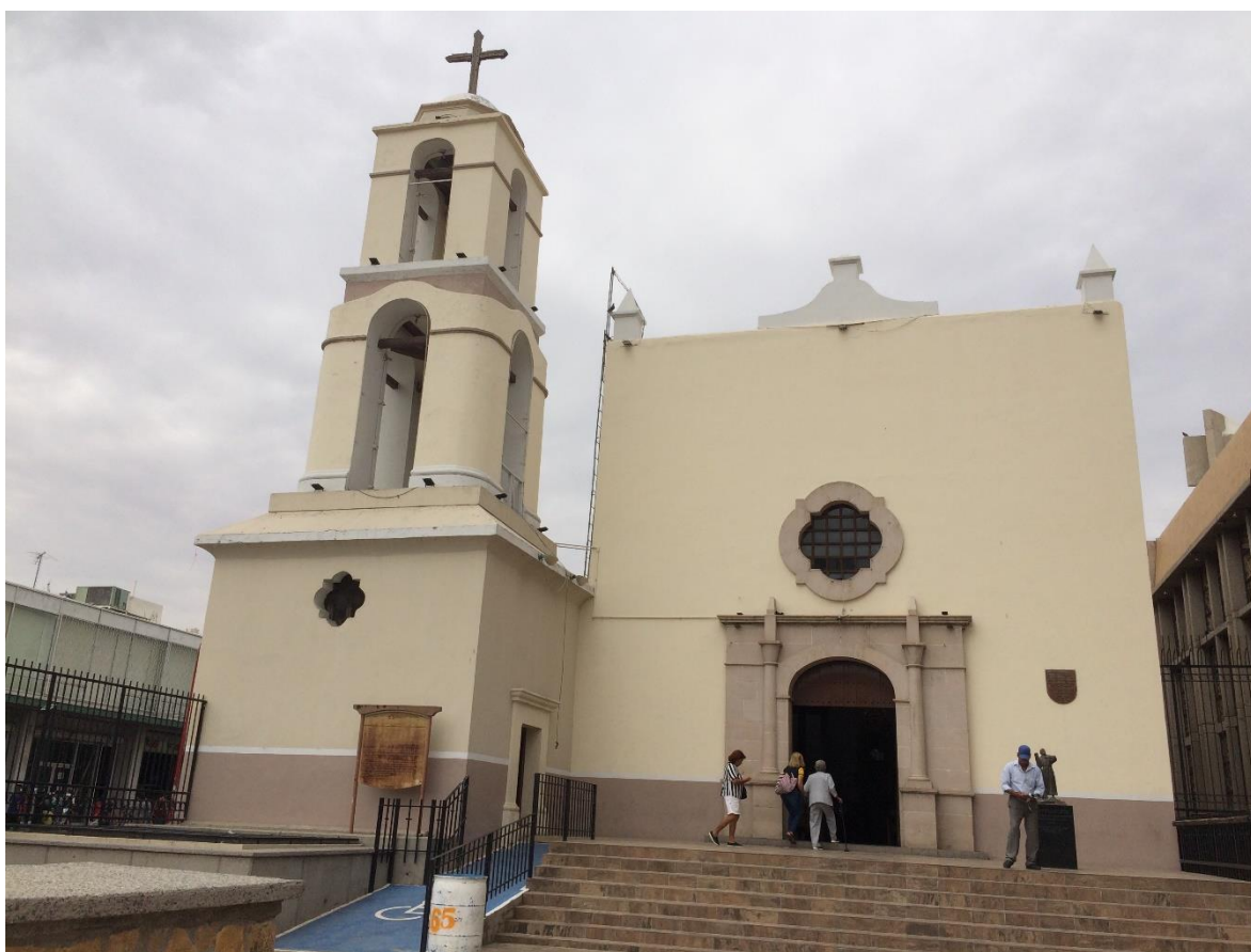
Figura 15. Fachada principal de la misión de Nuestra Señora de Guadalupe, restaurada de 1968-1971. 87

La Misión de Nuestra Señora de Guadalupe tiene orientación este-oeste, con acceso principal al este y presbiterio al oriente. Es un inmueble de un solo nivel, con torre al lado derecho de su fachada principal y servicios en el lado izquierdo del cuerpo del templo.