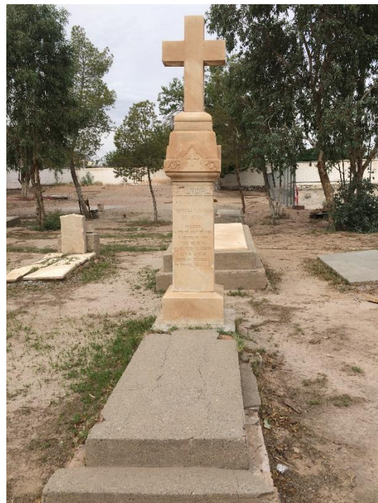
Figuras 12 y 13. Monumento de principio del siglo XX y del siglo XIX. 66