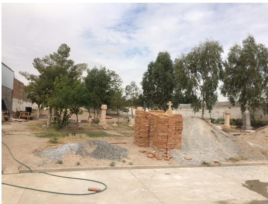
Figura 9. Estado actual del cementerio, con materiales de obra y al fondo, construcciones aledañas a él. 64

El carácter de este cementerio al parecer fue particular, ya que son pocas las tumbas que se encuentran aquí y solo las de las familias más reconocidas de la Villa del Paso del Norte, entre ellas de la familia Samaniego y Ochoa. Cuenta con tumbas con expresión estilística semejantes al del Santuario de Guadalupe en Chihuahua. 63