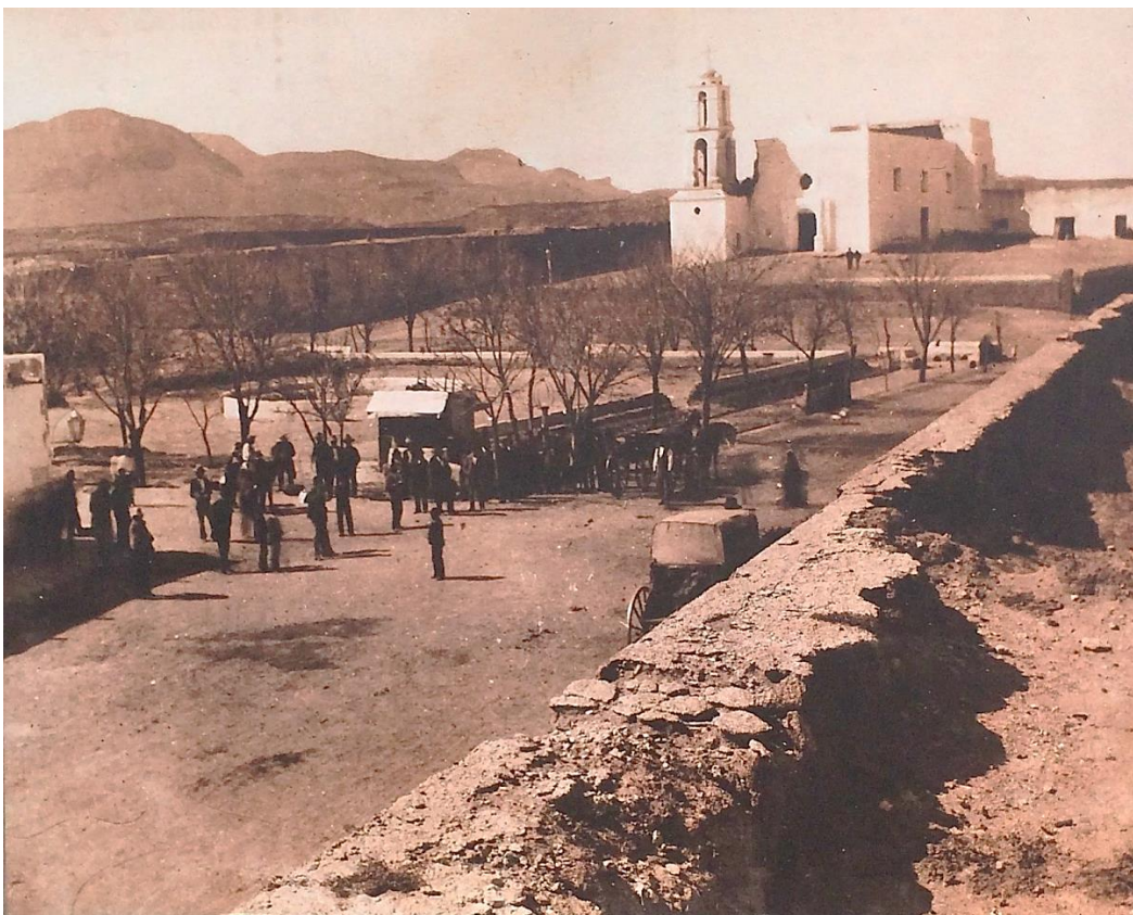
Figura 14. La misión de Nuestra Señora de Guadalupe, en 1905. 75

En 1967, el arq. Lacouture dirige una solicitud al Departamento de Monumentos Coloniales del INAH con relación a una petición de asesoramiento y orientación a su cargo para la restauración de la iglesia de Nuestra Señora de Guadalupe mencionando la necesidad urgente de consolidar la edificación para evitar derrumbes. 76 El proyecto de restauración, ya dictaminado por el Departamento de Monumentos Coloniales del INAH es autorizado, al año siguiente, por la Secretaría de Patrimonio Nacional. 77