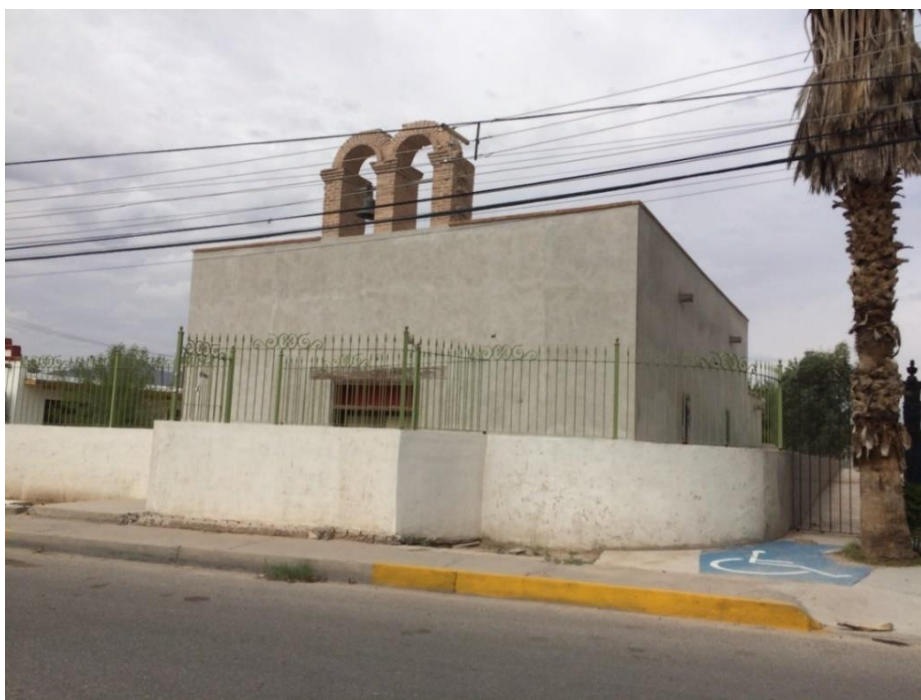
Figura 2. Estado actual de la fachada principal. Obra en proceso. 50

Con relación a sus interiores, su techumbre es un alfarje de dos órdenes. 47 El cementerio que se encuentra en la parte posterior del predio está rematado por un pozo de absorción que tiene la finalidad de evitar posibles inundaciones y posteriores afectaciones al cementerio y al inmueble. 48 La capilla es una sola nave con crujías y presbiterio al fondo, con esquema arquitectónico original, 49 de formato cuadrangular mientras que la sacristía e inmuebles que la acompañan son más bien rectangulares.