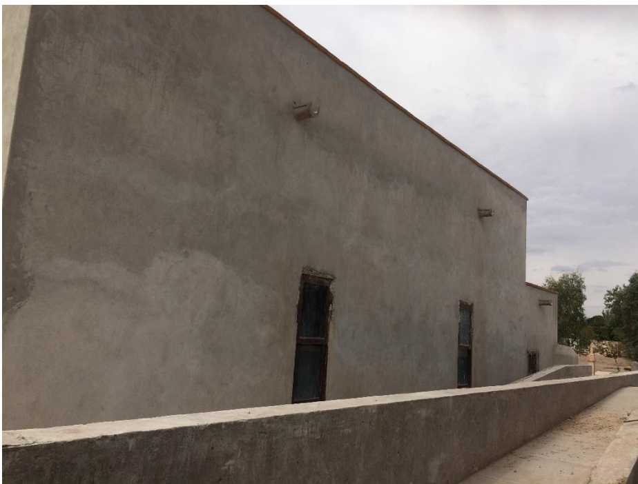
Figura 5. Estado actual de las fachadas posterior y lateral de la capilla. Actual obra en proceso. 52