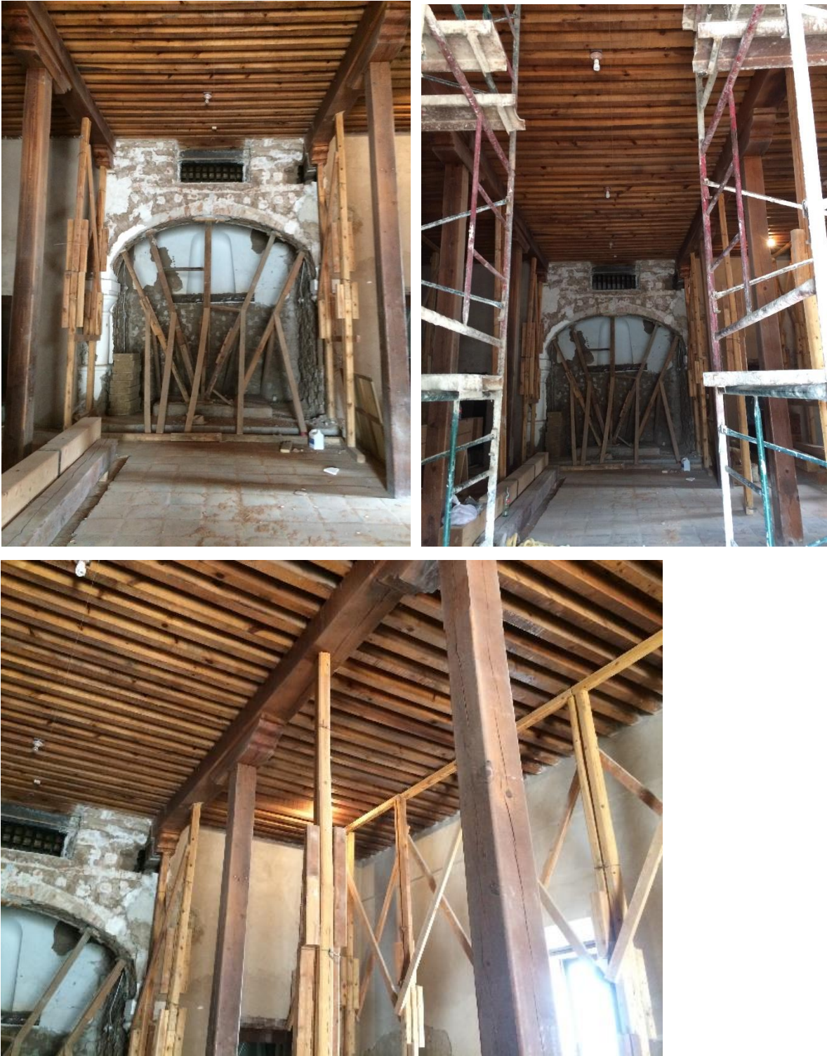
Figuras 6. 7 y 8. Estado actual del interior de la capilla, postes de madera y pies derechos soportando el forjado de un solo orden. Actual obra en proceso 61 .