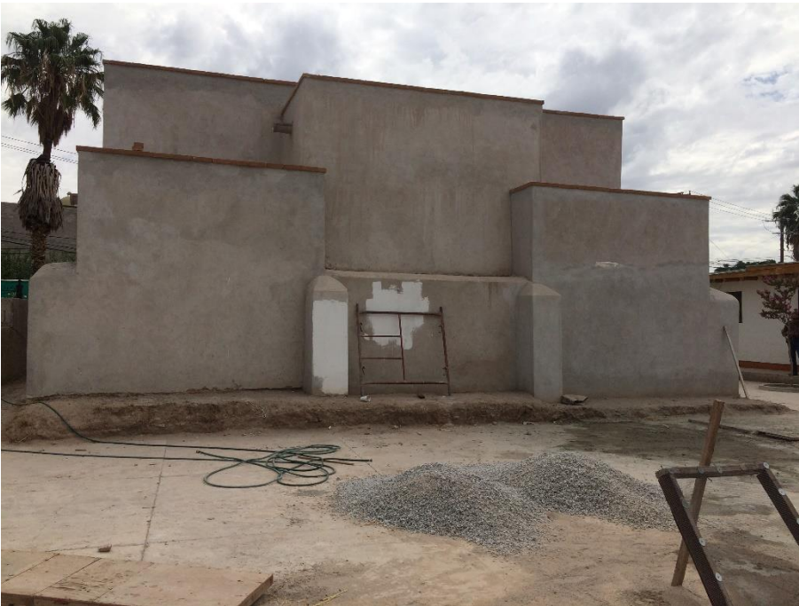
Figuras 3 y 4. Fachada lateral y posterior. Obra en proceso. 51