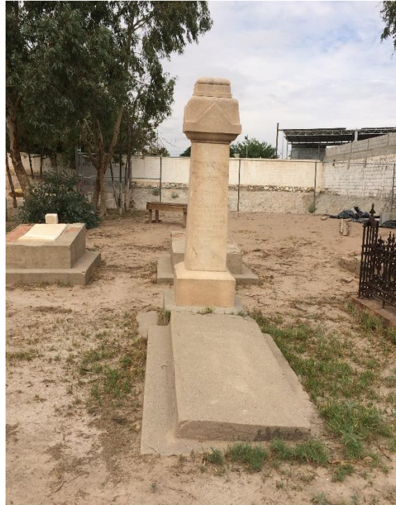
Figuras 10 y 11. Algunos de los monumentos en el cementerio. 65