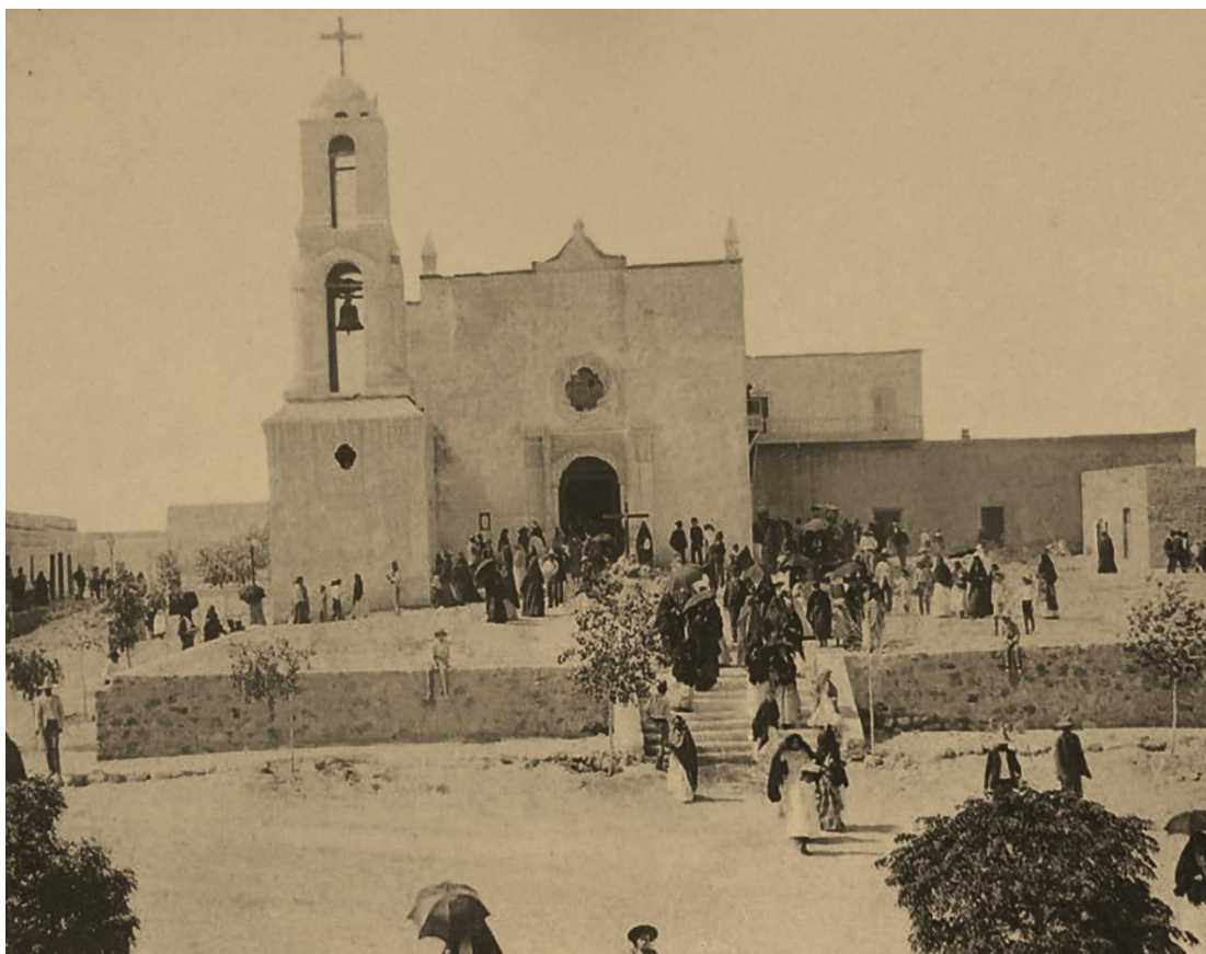
Figura 14. “Festividades de la Virgen de Guadalupe o la “Feria de Guadalupe”, celebraciones que se realizaron desde el siglo XVII. En 1745, la población indígena se rebeló y la fiesta se canceló. 84

En casi todas las fotos que hemos revisado se muestran edificaciones justo al lado derecho del templo, sin características conventuales tradicionales. Así lo muestran las fotografías incluidas en la exposición conmemorativa actual en el atrio compartido por ambas iglesias.