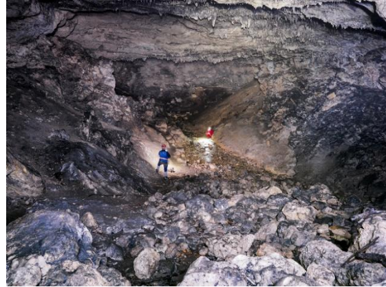
Figs. 5 y 6: Galería principal