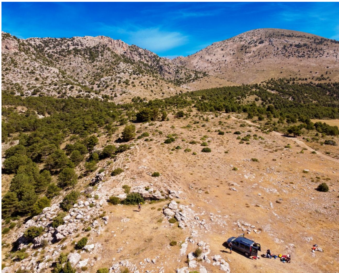
Figs. 2 y 3: Situación de la cavidad