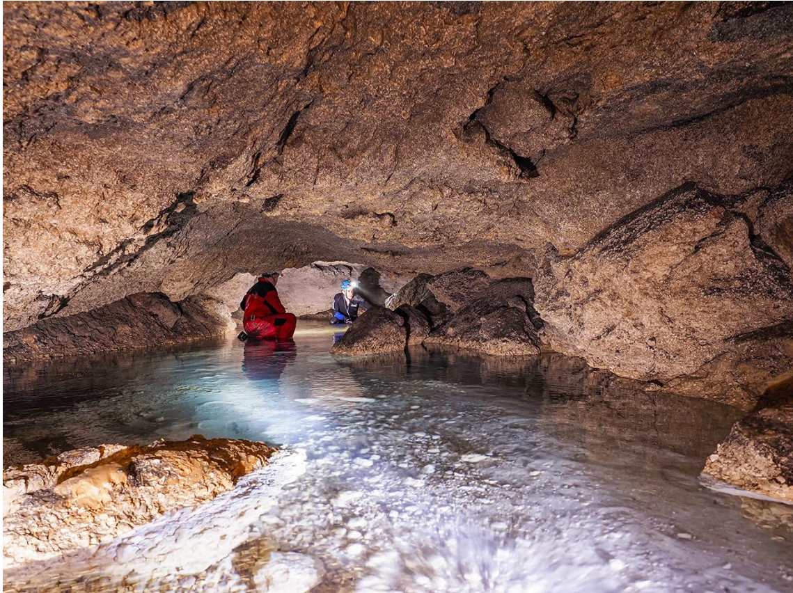
Fig. 8: Galería inundada tras el "besatechos"