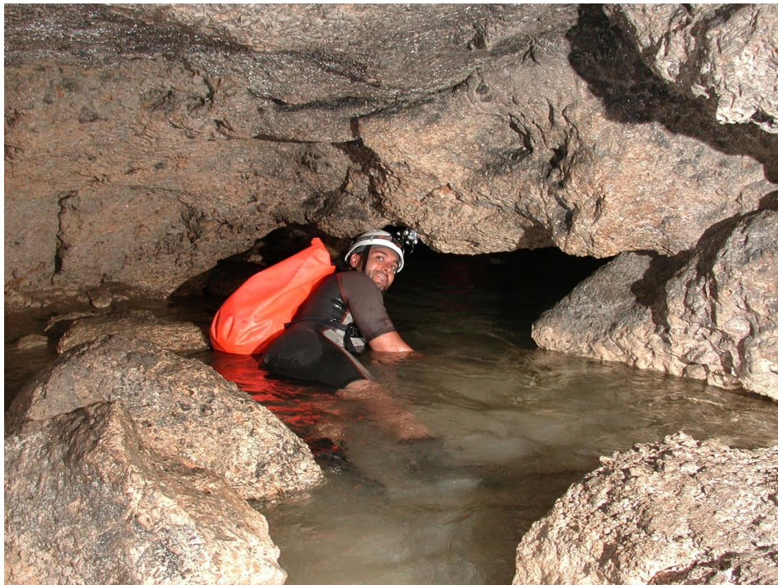
Fig. 7: Jesús entrando en el “besatechos”