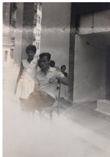
Fotografía de archivo, entrega de viviendas en Palma Plamilla. (Palma Palmilla, 2015-2018)