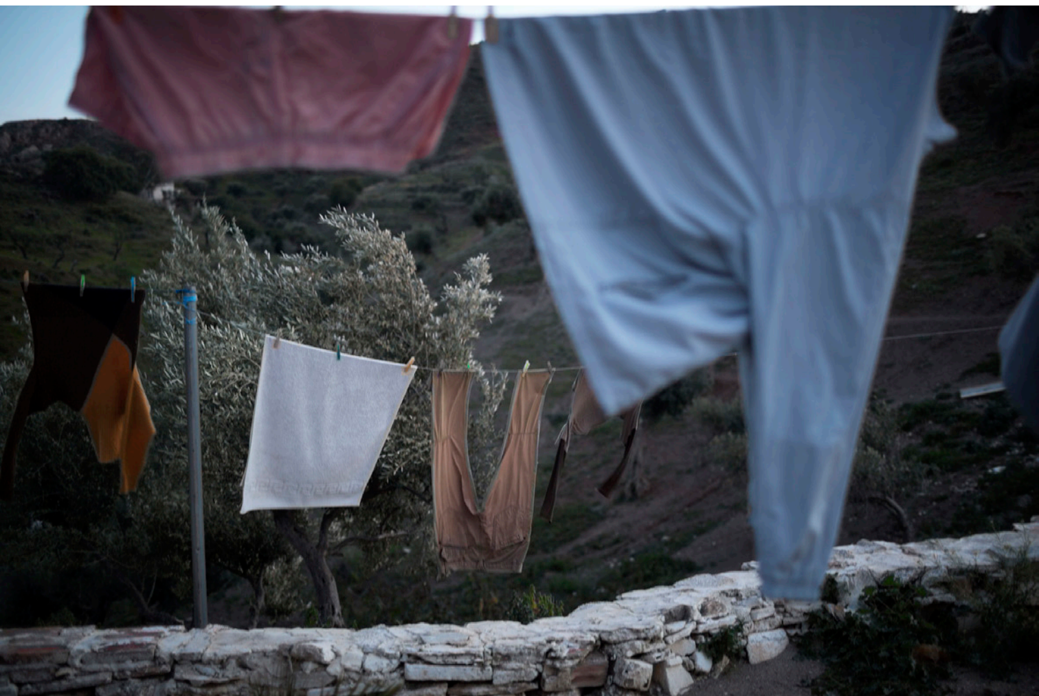
Tendal de ropa limpia en la Casa de la Buena Vida. (Palma Palmilla, 2015-2018)