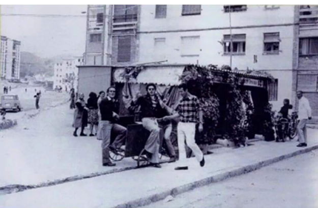
Fotografía de archivo, bar el Tropezón, Palma Palmilla. (Palma Palmilla, 2015-2018)