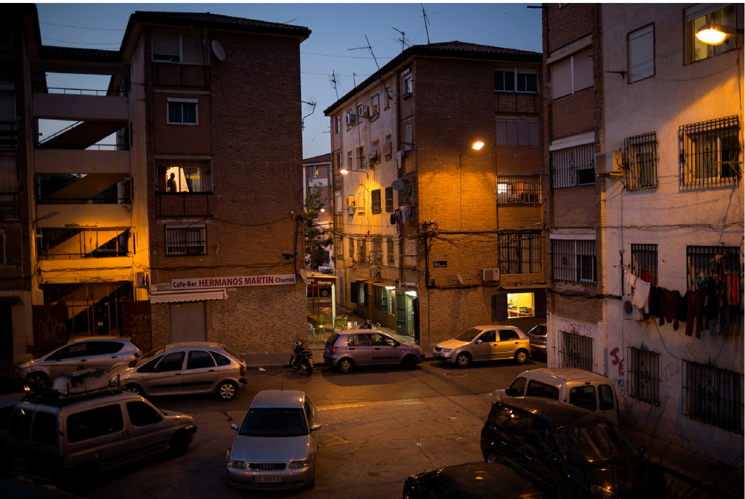
Vistas al anochecer desde la C/Guadalén. (Palma Palmilla, 2015-2018)