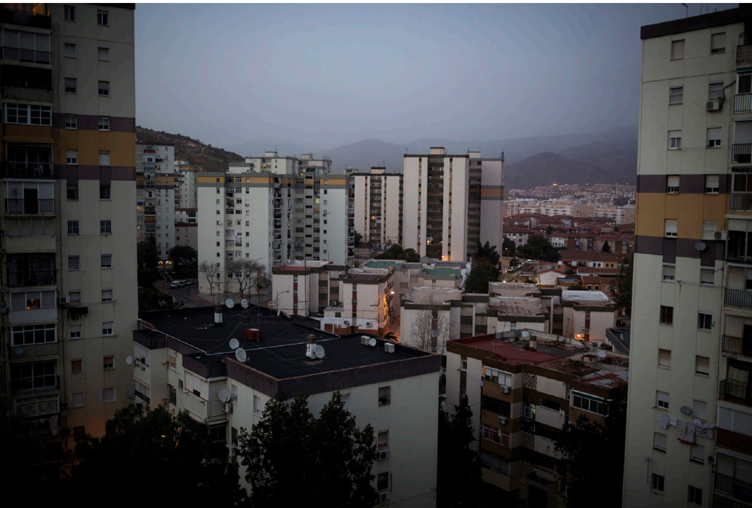
Panorámica de Palma Palmilla desde un balcón de una vivienda en la C/Deva. (Palma Palmilla, 2015-2018).