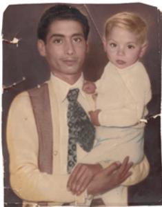
Fotografía de archivo familiar de la familia de los Charros (Palma Palmilla, 2015-2018)