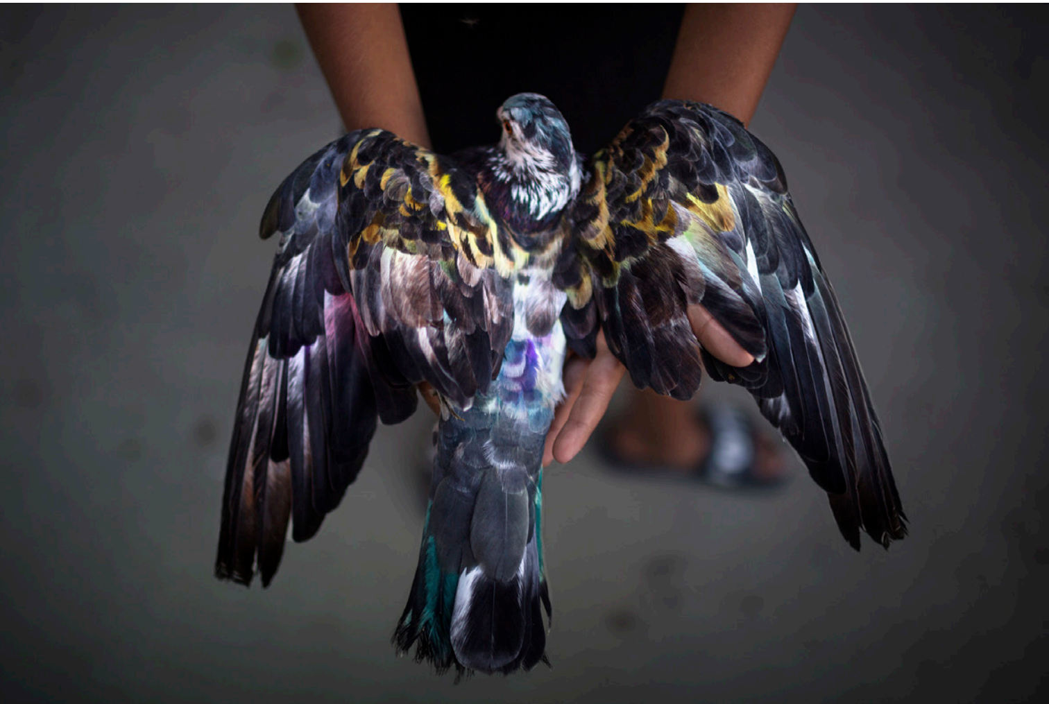
Paloma pintada. (Palma Palmilla, 2015-2018)