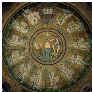
Ricardo da COSTA (org.). Mirabilia Journal 32 (2021/1)