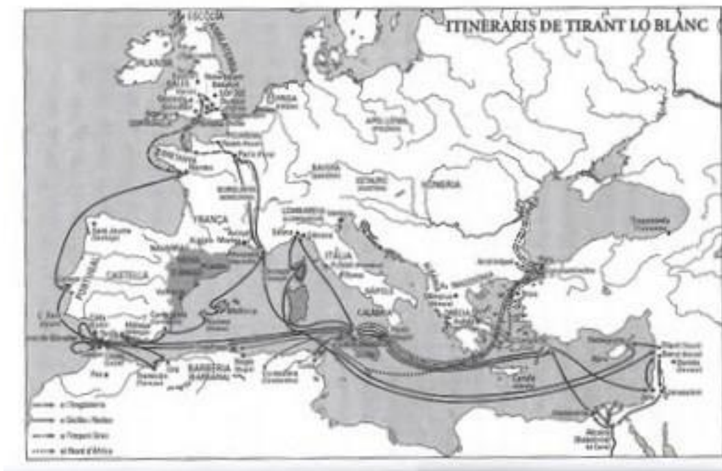
Mapa del itinerario de Tirant lo Blanc.