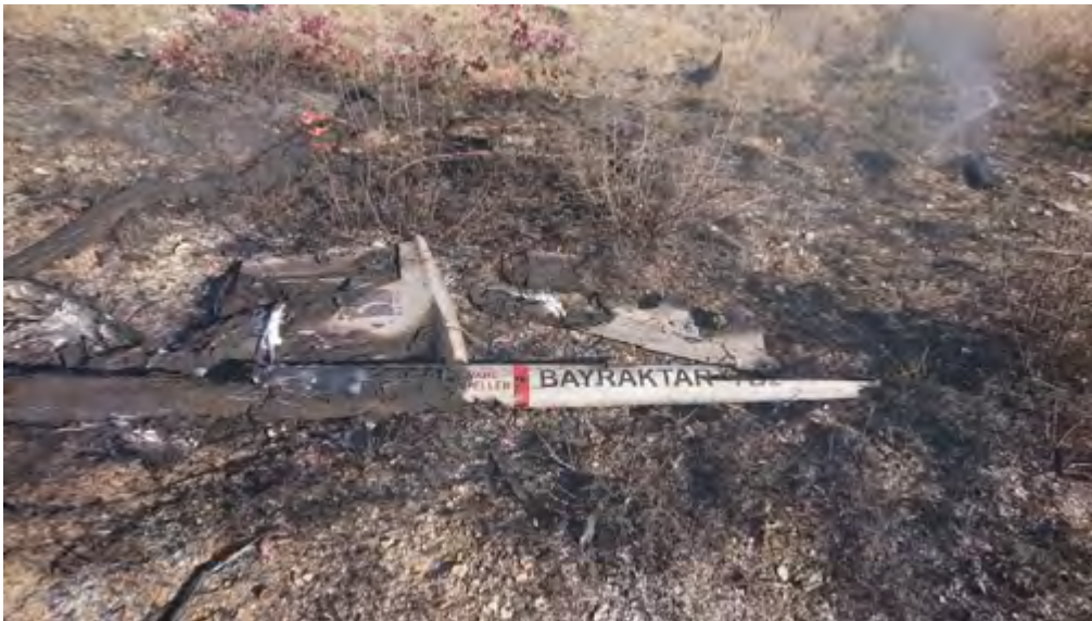
Figura 2. Restos de un dron TB-2 azerí derribado por las fuerzas de defensa aérea armenias.

Según algunas publicaciones, basadas en información de fuentes abiertas, se habrían derribado o capturado un total de 25 drones 16 , cifra muy lejos de, por ejemplo, los 200 drones Harop que afirma haber destruido Armenia en 2020, a los que habría que sumar decenas de drones TB-2 supuestamente neutralizados 17 .