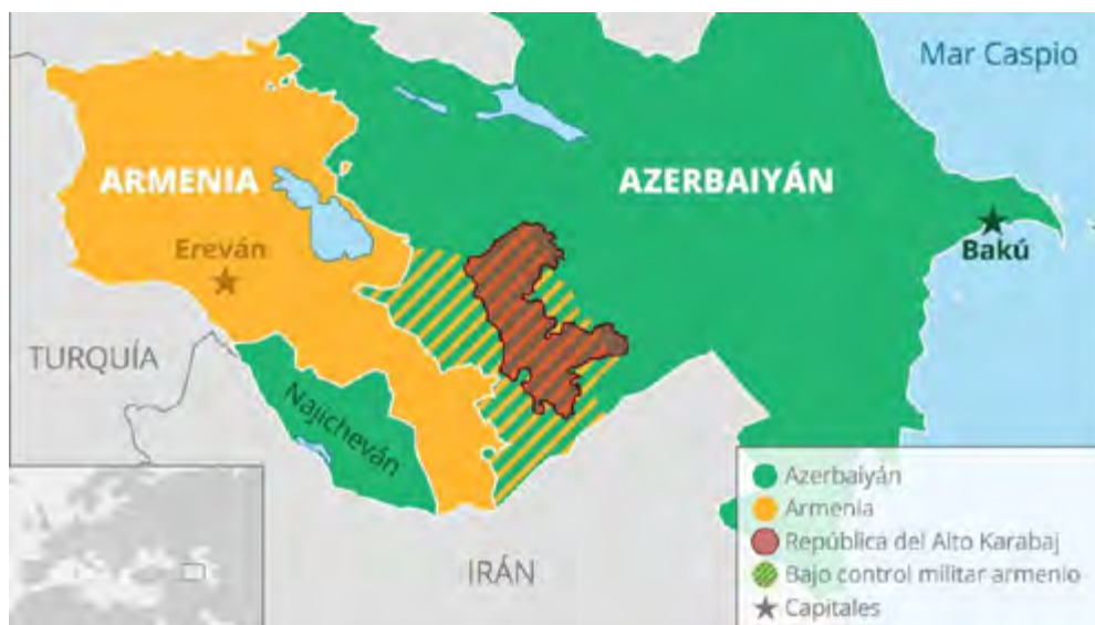
Figura 1. Mapa de situación con anterioridad al conflicto. Fuente. Disponible en: https://www.lavanguardia.com/vida/junior-report/20201016/484102292861/preguntas-y-respuestas-sobre-el-conflicto-en-nagorno-karabaj.html

El domingo 27 de septiembre de 2020 se retomaron las hostilidades en la línea de contacto de la región de Nagorno Karabaj, entre las repúblicas de Armenia y de Azerbaiyán. Este enclave, fruto de la desintegración de la Unión Soviética y de su otrora conocida como oblast 1 autónoma del Alto Karabaj, ha sido fuente de numerosos enfrentamientos entre ambos países.