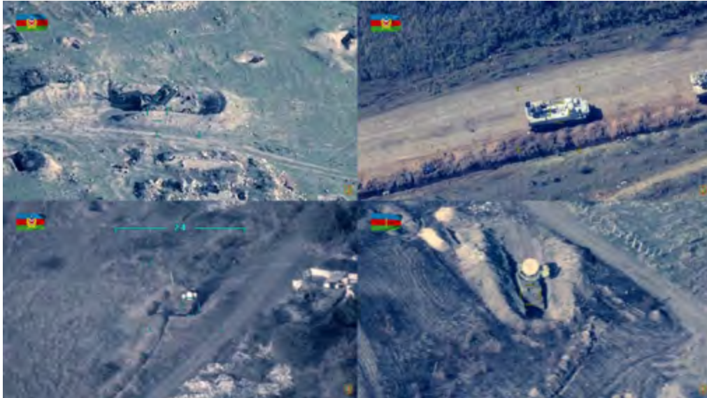
Figura 3. Dron TB-2 azerí abatiendo sistemas antiaéreos armenios. Fuente. Ministerio de Defensa de Azerbaiyán. Disponible en: https://www.youtube.com/watch?v=WGpOg93GPKq y https://www.youtube.com/watch?v=bNoPM5T6qoE