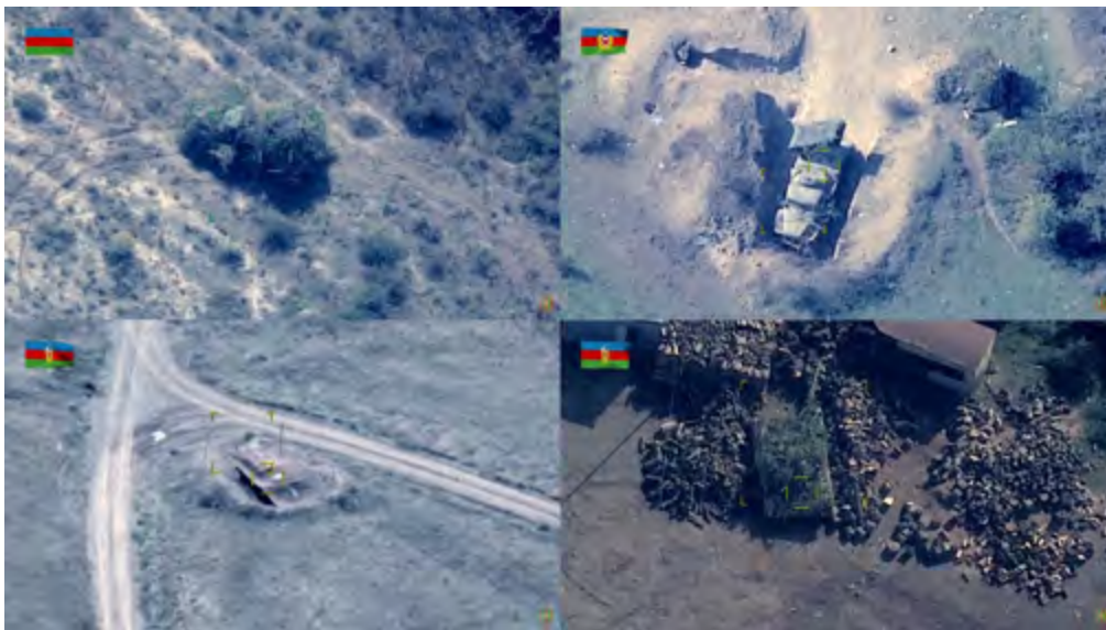
Figura 5. Varios tipos de camuflaje y ocultación de las fuerzas armenias.

Evitar la detección por medio de camuflajes es extremadamente complejo, ya que eliminar totalmente la huella visual y térmica es prácticamente inviable. A su vez debe ser aplicado tanto en condiciones diurnas como nocturnas, debido a la capacidad de operación nocturna de los drones. Por ello, debe ir acompañado de otras medidas de defensa pasiva como la dispersión, «bunkerización», ocultación o la decepción, como el uso de señuelos 34 . A su vez, las tropas deben estar instruidas y concienciadas.