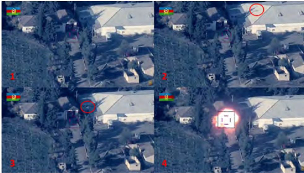
Figura 6. Secuencia de ataque a un SA-15 con munición merodeadora.