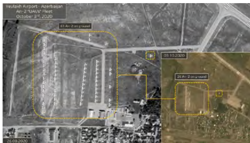
Figura 4. Aeropuerto de Yevlakh (Azerbaiján), con 61 An-2 en plataforma.

En general, la combinación de drones en misiones ISTAR, drones de combate TB-2 armados con misiles MIM y munición merodeadora específica para misiones SEAD se ha demostrado extremadamente eficiente frente a las defensas armenias, con la aplicación de tácticas y estrategias específicas para cada tipo de sistemas de armas antiaéreas acometido.