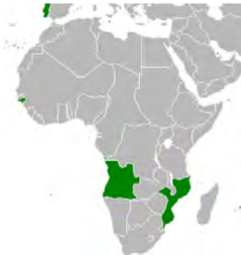
Figura 2. Colonias portuguesas en África.

El presidente del FRELIMO, Samora Machel, trató de modernizar el país siguiendo los patrones de la URSS. Para ello, nacionalizó empresas, estableció un férreo control de la población, eliminó la cultura tribal y redujo la influencia religiosa. Los Estados Unidos, preocupados por la expansión soviética en el África subsahariana, junto a Sudáfrica, que veía como el comunismo se instalaba en su frontera, crearon un grupo opositor al FRELIMO llamado Resistencia Nacional de Mozambique (RENAMO). Las luchas entre ambos movimientos dieron lugar a una guerra civil de quince años. Para no distraer tropas mozambiqueñas involucradas en la guerra, Samora Machel acordó con los Gobiernos de Malawi y Zimbabue el despliegue de sus soldados en Mozambique para garantizar la seguridad de las comunicaciones con ambos países.