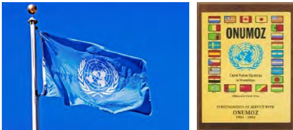
Figura 3. ONUMOZ: Operación de las Naciones Unidas en Mozambique y países integrantes de ONUMOZ.

Naciones Unidas. Se puso en marcha la Operación de las Naciones Unidas en Mozambique (ONUMOZ) y un contingente de observadores internacionales, entre ellos veinte españoles, se desplegó en el país para verificar los acuerdos firmados.