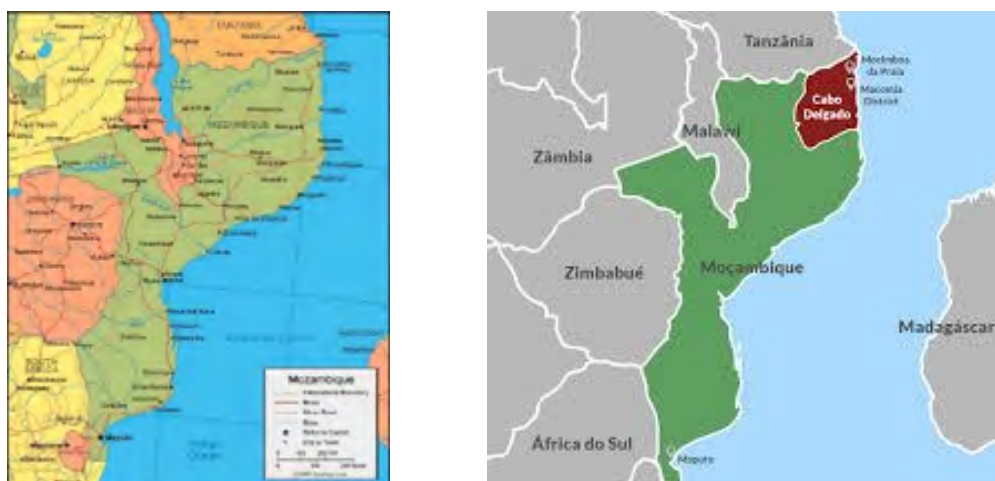
Figura 4. Mozambique y Cabo Delgado.

Cabo Delgado es una provincia que ocupa la zona más septentrional del norte de Mozambique. El río Rovuma hace de frontera natural con Tanzania. En el año 2020, su población ascendía a 2,5 millones de habitantes, más del 60 % musulmanes (en todo el país esta comunidad representa el 18 %). Su capital es Pemba, y otros municipios importantes son Mocimboa da Praia y Montepuez.