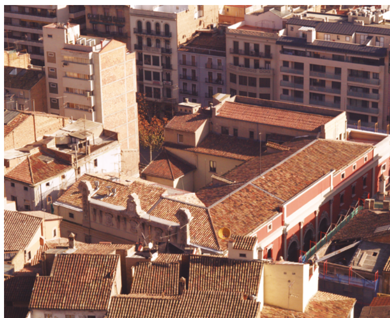
Fig. 1. Vista de l'actual edifici de la Diputació de Lleida, cantonada entre els carrers del Carme i de l'Audiència. Antic Hospici de Lleida, construït sobre la casa on va viure els darrers mesos Gaspar de Portolà.

El 6 de març de 1790 el Consell de Castella emet una circular als prelats d'Espanya per recaptar informació sobre la situació de les cases d'expòsits de les seues respectives diòcesis. Els resultats són, com era d'esperar, preocupants. Tots manifesten l'escassetat de recursos econòmics, el gran nombre d'expòsits als quals han d'assistir, les condicions inhumanes de les