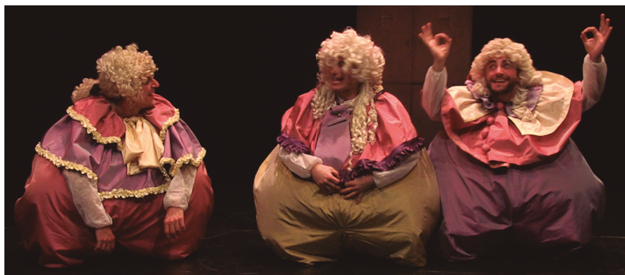
La flauta màgica. Temporada 2013-2014.