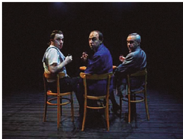
Fum de Teatre de guerrilla. Temporada 2010-2011.

També compleixen un paper important les xarxes que s'organitzen al voltant del món teatral. En el cas de l'Ajuntament de Tàrrrega pertanyem a la Xarxa Alcover de Teatres, un projecte que abasta tots els territoris de l'àmbit lingüístic català: Catalunya, País Valencià, Illes Balears i Andorra, i que treballa amb l'objectiu que els millors espectacles en llengua catalana es coneguin arreu, ja que massa sovint, tot i compartir una mateixa llengua, el desconeixement mutu en l'àmbit teatral és la tònica imperant.