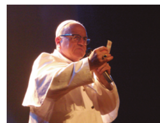
El mètode Grönholm. Temporada 2005-2006.