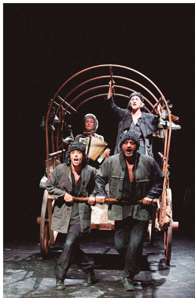
L'orfe del clan dels Zhao. Temporada 2014-2015.