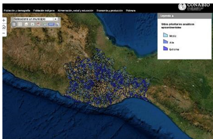
Mapa V. Sitios Prioritarios Acuáticos Epicontinentales.

Nos gustaría finalizar este apartado señalando que, pese a la diversidad de estudios enfocados en la región 9 , urge analizar el impacto de este tipo de proyectos eólicos en las 795 diferentes clases de mamíferos que se conocen en la zona, en las más de 8.000 clases de insectos, 240 de hongos o en las 3.270 especies de plantas registradas en el área (Sistema Nacional de Información sobre Biodiversidad, SNIB (2020).