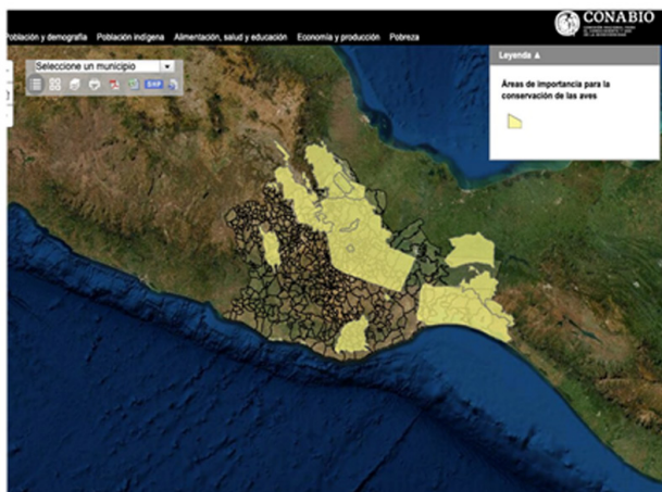
Mapa III. Áreas de Importancia para la Conservación de Aves en Oaxaca.

En ese mismo sentido, cerca del 40% del territorio oaxaqueño está considerado dentro del programa Sitios Prioritarios Terrestres o Regiones Terrestres Prioritarias (RTP), que son sitios con características relacionadas con la biodiversidad, riqueza, endemismo de especies, rareza de tocones, fenómenos ecológicos y evolutivos como migraciones o adaptaciones, o por la rareza en el ámbito global de sus tipos de hábitat, de acuerdo con el estado de conservación y las amenazas a la biodiversidad. Se han identificado sitios de extrema, alta y media prioridad que requieren de manejos sustentable y conservación (Mapa IV).